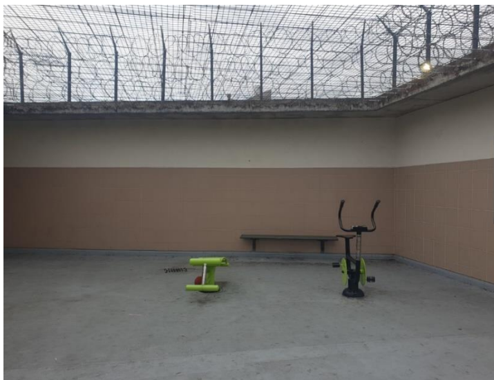
Cour de promenade sur le toit

Une cour de promenade extérieure est située au dernier étage, sur le toit. C'est une terrasse d'aspect carcéral, ceinte de murs de grande hauteur équipés de concertinas, recouverte de grillage et de filins alors qu'un espace à l'air libre en rez-de-chaussée n'est pas utilisé. En journée, les retenus y ont un libre accès de 7h00 à minuit. Il est possible d'y fumer ; à cet effet, des allume-cigarettes sont fixés dans le mur.