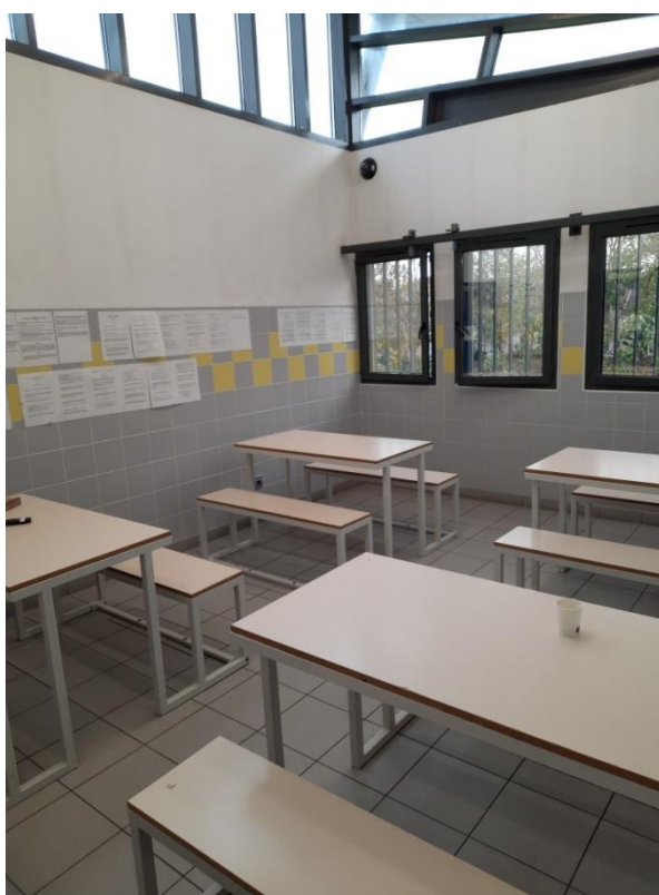
Salle de restauration

La distribution s'effectue à l'étage, à l'entrée de la salle à manger, par la cuisinière. Le chef de poste appelle les personnes retenues et lorsque l'une d'elles manque à l'appel, un policier va la chercher en chambre.