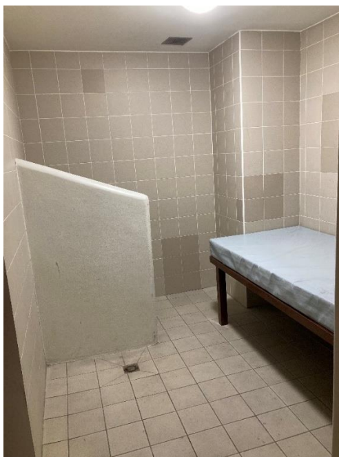
Chambre de mise à l'écart

L'étude des données transmises permet de constater que la reprise d'activité du centre à taux plein depuis octobre 2022 s'est traduite par une augmentation significative du nombre de mises à l'écart. En effet, il y a eu seize placements en chambre de retrait entre janvier et août 2022, puis treize en un mois entre le 5 octobre et le 4 novembre 2022. Ce même mois, il y a également eu deux outrages, quatre faits de violence entre retenus et deux refus de repas. L'augmentation du nombre de mises à l'écart est expliquée par une plus grande promiscuité entre des communautés qui cohabitent difficilement, mais aussi parce que les autres centres de rétention auraient transféré leurs éléments les plus perturbateurs vers le CRA de Plaisir lorsque sa capacité d'accueil a été augmentée de nouveau. Le centre est toujours doté d'une chambre de mise à l'écart, qui est identique à sa description du rapport de 2014. Il s'agit d'une pièce aveugle avec un lit scellé au sol. Le principal changement opéré est la désactivation de la caméra de vidéosurveillance, toutefois toujours présente dans le local.