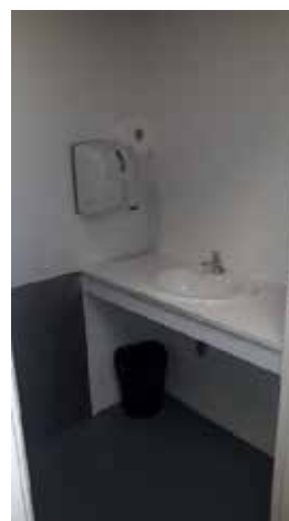
Le local sanitaires du 4 ème étage