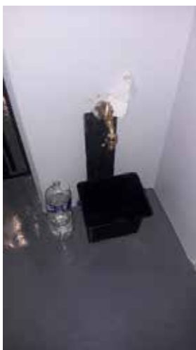
Le robinet situé dans le couloir du sous-sol, à une quarantaine de centimètres du sol

Comme indiqué précédemment, aucun lavabo ni point d'eau n'est accessible aux personnes privées de liberté dans la zone du sous-sol. Seul un robinet d'eau froide, situé dans le couloir, à une quarantaine de centimètres du sol et de toute évidence destiné au ménage, permet de remplir des bouteilles ou gobelets, mais en aucun cas d'effectuer un brin de toilette ni même de se laver les mains. Cette situation déjà choquante en temps normal, est inacceptable en période de pandémie, privant les personnes enfermées de toute possibilité de respecter un minimum les gestes barrières.