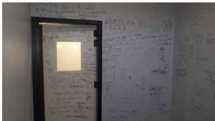
Cellule du 4 ème étage couverte de graffitis

Comme au sous-sol, les cellules du 4 ème étage sont très propres. L'une d'elle est toutefois recouverte de graffitis et nécessiterait des travaux de réfection.