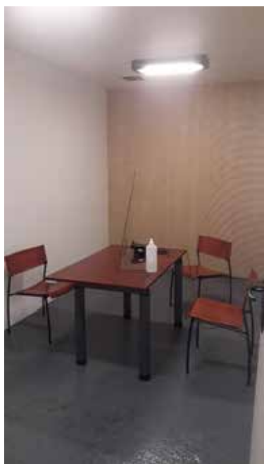
Salle d'entretien du sous-sol

Par ailleurs, l'absence de bouton d'appel dans cette cellule aménagée (contrairement au local entretien qui dispose d'un bouton situé sous le bureau) a été évoquée par plusieurs interlocuteurs comme cause d'inquiétudes, la télécommande portative mise à disposition s'avérant insuffisamment fiable en cas d'alerte, et ce alors même que la porte est fermée à clé (cf. § 1.5.1).