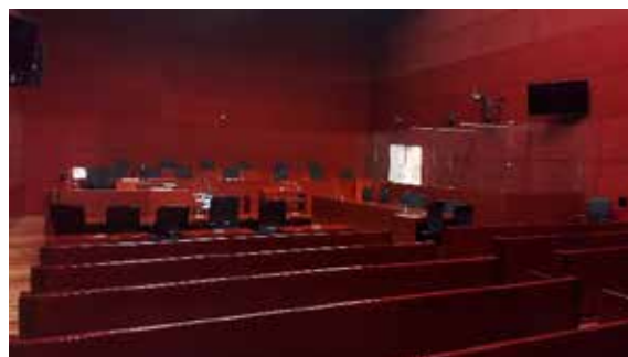
Box d'une salle d'audience (cour d'assises)