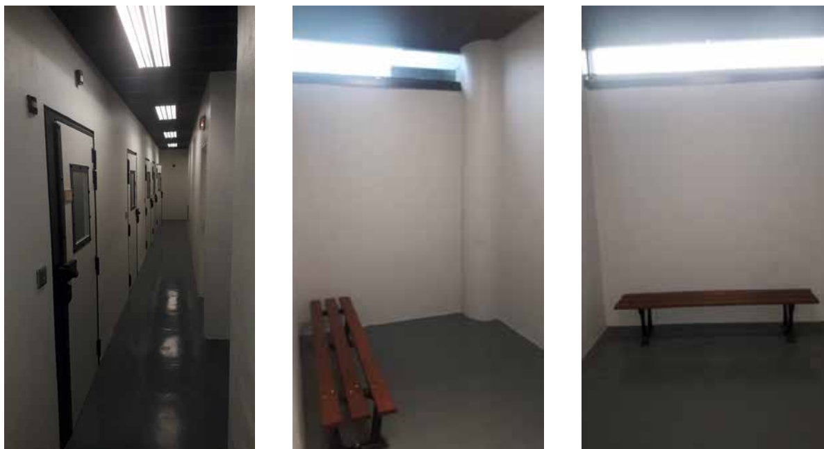
Vues de cellules du 4 ème étage

Comme au sous-sol, les cellules du 4 ème étage sont très propres. L'une d'elle est toutefois recouverte de graffitis et nécessiterait des travaux de réfection.