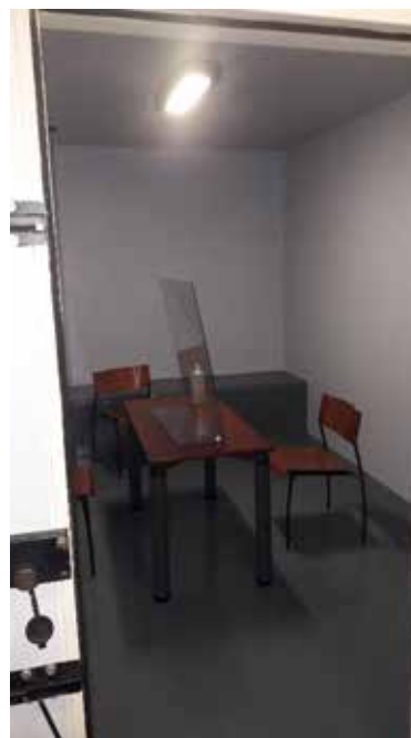
Cellule transformée en salle d'entretien au sous-sol