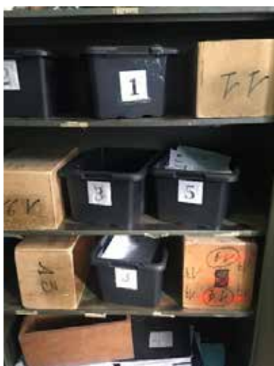
Boîtes de fouille

Dans ses observations du 4 janvier 2021 faisant suite au rapport provisoire, le commissaire indique qu'un rappel sur ce point a été réalisé dans la note de service du 16 décembre 2020 relative à la prise en charge des personnes privées de liberté au paragraphe I.3. En conséquence la recommandation est considérée comme prise en compte.