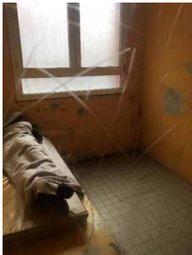
Cellule de garde à vue

Les deux cellules de GAV, de 6,75 m 2 , disposent d'un bat-flanc permettant à une personne de s'allonger, surmonté d'un matelas en mousse plastifié. Une fenêtre sans poignée dotée de carreaux opacifiés, grande (1,65 sur 1,87 m) et barreaudée, apporte la lumière naturelle. La peinture est écaillée et la vétusté évidente.