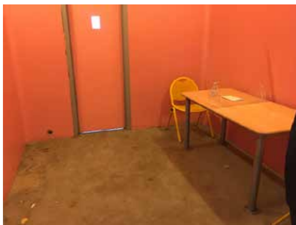
Salle d'entretien médecin et avocat

Au bout du couloir des cellules pour IPM, une pièce permet les entretiens avec le médecin ou l'avocat. Elle dispose de deux portes, l'une ouvrant dans l'espace sécurisé pour l'accès des personnes en garde à vue, l'autre ouvrant dans l'entrée du poste de police pour les intervenants extérieurs.