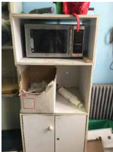
Micro-ondes et stockage des repas

Lors du contrôle, une vingtaine de barquettes étaient présentes dans la réserve, non périmées et avec deux choix ; « blanquettes de volaille et son riz » et « poulet basquaise et son riz ». Une quarantaine de briquettes de jus d'orange et un carton de biscuits secs en emballage individuel permettent la distribution d'un petit déjeuner. Aucune boisson chaude n'est proposée.