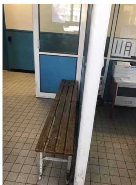
Banc d'installation lors de l'arrivée

La personne gardée à vue est enregistrée au niveau du poste sur un registre spécifique commun à toutes les entrées et sorties des personnes amenées. Deux bancs permettent une attente assise et ne sont pas dotés d'anneaux. La personne menottée par les forces de l'ordre le reste jusqu'à l'arrivée de l'OPJ qui vient lui notifier ses droits. La configuration de la salle du chef de poste, où sont assises les personnes privées de liberté, impose au policier de leur tourner le dos dès qu'il veut accéder au poste informatique.