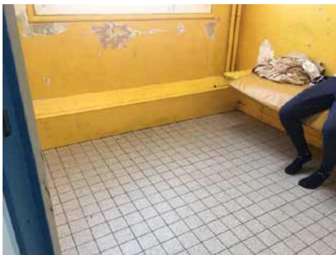
Cellule pour mineur

Une troisième cellule, dont la porte d'accès, pleine, donne directement sur le poste, est réservée aux mineurs mais peut servir de cellule pour hommes ou femmes en surnombre ou devant être séparés. Cette cellule ne dispose, elle aussi, que d'un bat-flanc et mesure 6 m 2 . Elle est éclairée, en face de la porte, par une grande fenêtre aux carreaux granités. Les peintures sont écaillées, le sol dégradé, l'aspect général vétuste et sale. La partie haute du mur donnant sur la pièce du chef de poste comporte des vitres qui ont été recouvertes de papier occultant.