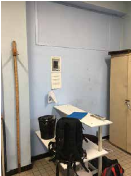
Salle de rédaction servant de local anthropométrie

Les opérations de prises d'empreintes sont réalisées dans une pièce dite salle de rédaction dévolue aux effectifs de brigades venant consigner leur rapport. Cette salle se trouve à une dizaine de mètres de la salle du chef de poste. Un coin de la salle dispose d'un socle permettant les prises d'empreinte, les photographies sont prises entre ce socle et le mur ; une toise permet de mesurer la taille. Pendant ces opérations la personne privée de liberté (PPL) est accompagnée par l'adjoint du chef de poste. La pièce est exiguë pour le nombre de personne qui y transitent, le lavage des mains après empreinte peut se faire par lingettes ou dans les toilettes du personnel de l'autre côté du couloir.