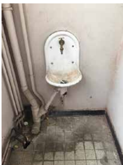
Point d'eau de la zone de sûreté

Les personnes en GAV (mais aussi en IPM) souhaitant utiliser des toilettes à assise sont amenées dans les toilettes du personnel à proximité où se trouve un WC accessible aux personnes handicapées.