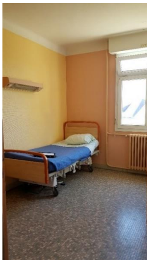
Chambres individuelles de Maine B4