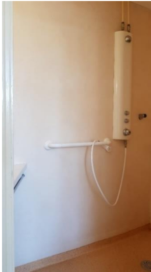
La salle d'eau d'une chambre double de Maine B 3

sont ouvertes de 7h45 à 9h et de 17h à 20h30 pour les patients qui n'en ont pas dans leurs chambres.