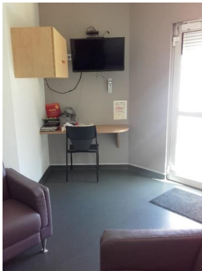
L'espace de visites de l'UPAO

Seule Loire D ne permet pas les visites dans les chambres. Dans quelques unités, les enfants ne peuvent pas entrer dans les chambres.