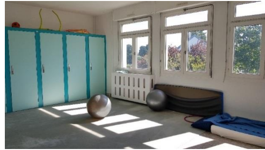
Espace d'apaisement de Maine B4

UPAO : Sur une file active de 1 152 patients, 119 (10 %) ont été placés en isolement lors de 140 mesures pour des durées allant de 0,5 à 384 heures (moyenne de 60 heures). 8 patients ont eu une contention associée lors de 13 mesures, soit 9 % des patients placés en isolement, pour une durée allant de 0,5 à 24 heures par mesure (moyenne de 12 heures). 29 mesures d'isolement (21%) ont été initiées alors que le patient se trouvait en SL. 12 mesures (8,6 %) sont mentionnées faites en chambres normales.