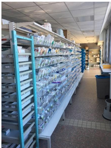
Pharmacie à usage intérieur

L'analyse pharmaceutique est faite sur toutes les ordonnances. Elle est renforcée dans les unités Maine A2 et Loire E : la pharmacienne va assister aux réunions cliniques de ces deux unités.