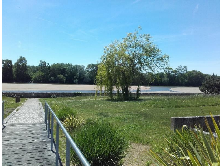
Promenade aménagée en bord de Loire

Il subsiste de cette longue histoire le mur d'enceinte de la propriété, ouverte sur la ville et sur le fleuve, ainsi que plusieurs bâtiments comme la chapelle ou le château du XVIII ème siècle qui abrite l'administration générale.