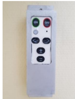
Salle de télévision, télécommande fixée au mur (unité Maine B4)