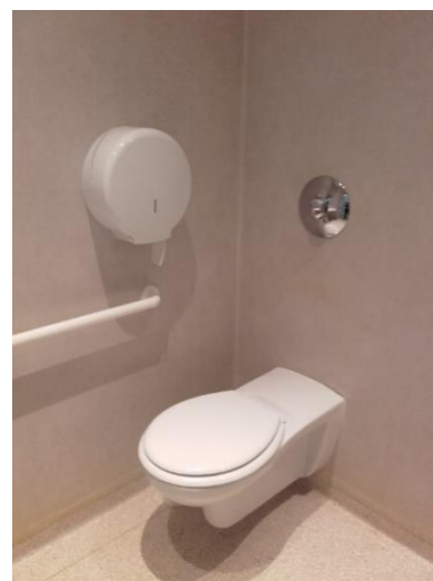
Salle d'eau d'une chambre de l'UPAO