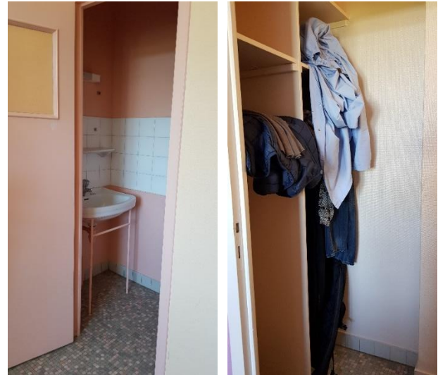
Un cagibi lavabo de Maine B4

Chaque patient reçoit une serviette et un gant de toilette. Les patients démunis et sans famille peuvent recevoir, à leur demande, dentifrice, mousse à raser, shampoing, savon, brosse à dents. Les draps sont changés au moins une fois par semaine et plus si nécessaire.