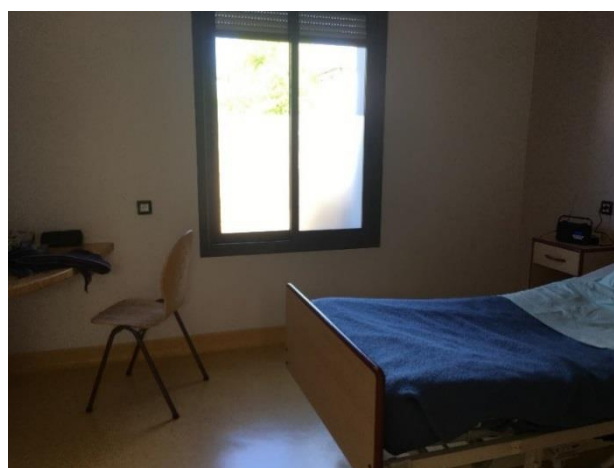
Une chambre de Loire D