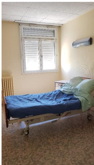
Une chambre individuelle de Maine B3