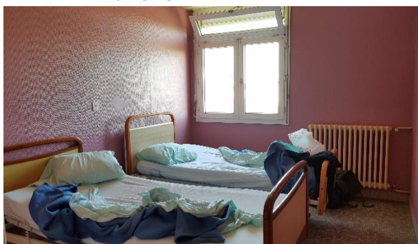
Une chambre double de Maine B4