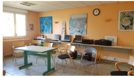
Salle d'activité de deux unités de Maine