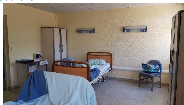
Une chambre double Maine B3