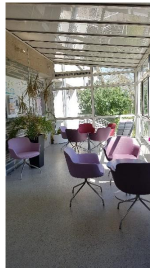
Le hall d'accueil de Maine B

Dans le rapport provisoire, le CGLPL avait recommandé que chaque unité dispose d'un local garantissant la confidentialité des visites. En réponse, la direction de l'établissement a précisé que « même si certains visiteurs choisissent de visiter leurs proches dans un espace commun, chaque unité dispose bien d'un espace d'accueil dédié aux familles, en son sein, comme en témoignent [...] les plans de masse des unités. S'agissant de Maine B, service déménagé depuis février 2020, le plan fourni permet d'identifier la localisation du salon des familles tel qu'il existe aujourd'hui », et le CGLPL se plie à ces arguments.