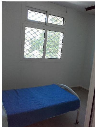
Chambre sécurisée de l'unité Maine A2, temporairement installée dans l'unité 15 Ouest

Ces CS sont non seulement utilisées pour les patients détenus mais aussi pour tout patient nécessitant une mesure d'isolement voire comme une « chambre normale » (cf.§.8). Il a été dit aux contrôleurs que les CS se distinguent des CI en ce que les premières ont un rideau métallique sur la fenêtre. Le document relatif aux préconisations concernant les indications et les conditions d'utilisation des CS, en date du 22 octobre 2009, les définit aussi comme équipées d'une salle d'eau cloisonnée en accès libre. Pour augmenter sa propre sécurité, le personnel souhaite avant tout pouvoir placer les patients détenus dans une chambre aménagée avec un sas, dont ne disposent pas toujours les CS. Ainsi, le dispositif de CS par rapport à celui de CI a été présenté aux contrôleurs à Maine de façon inverse à ce qu'il l'a été à Loire, la distinction entre CS et CI reposant dans l'esprit de certains soignants sur l'existence d'un sas et non sur l'existence du rideau métallique. Dans la pratique, CS et CI ne peuvent pas être distinguées, et sont confondues.