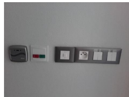
Chambre de l'UPAO