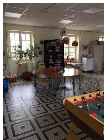
Centre de médiation pour activités thérapeutiques pôle Loire

Le centre de médiation du pôle Maine, ouvert depuis un an et demi, dessert les patients de cinq unités du pôle (Maine A et B, URP) et bientôt l'unité FAPA. L'essentiel des activités