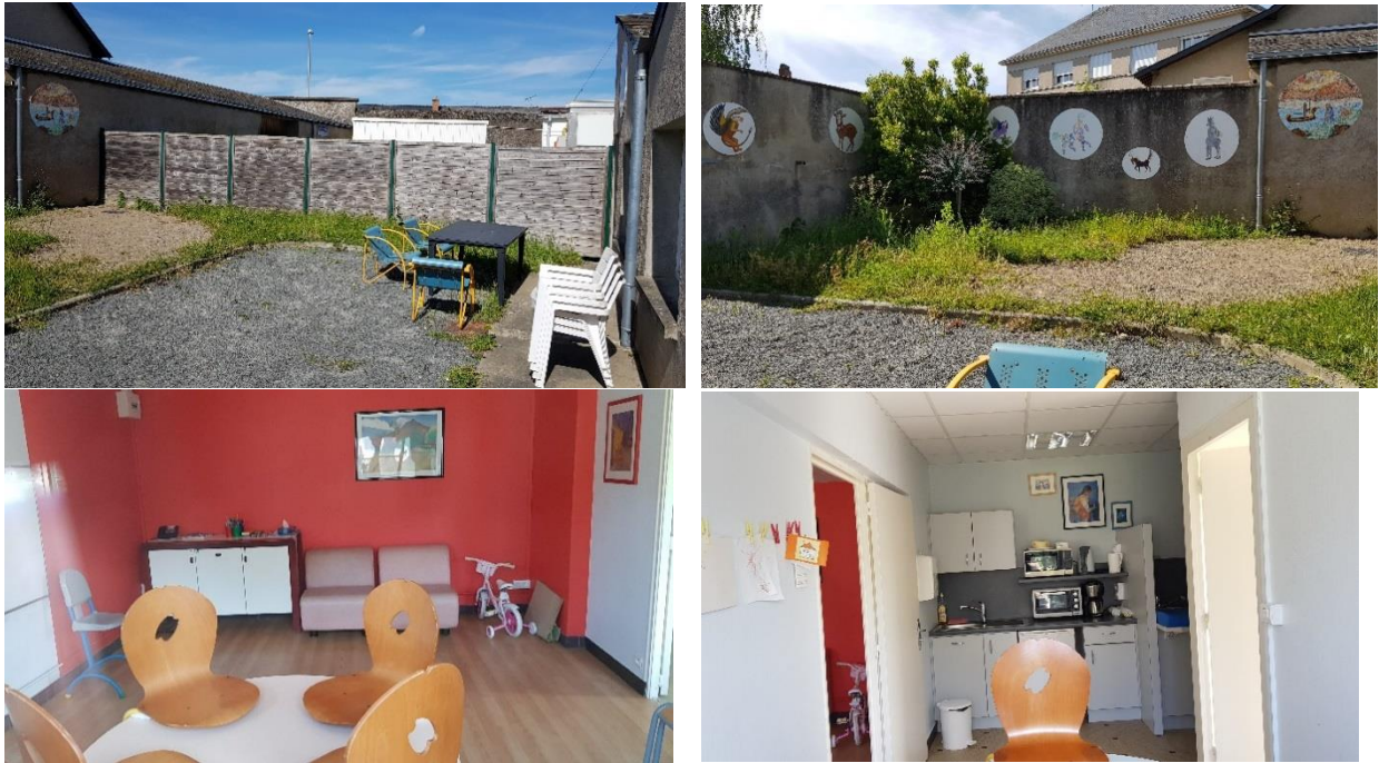
La petite maison