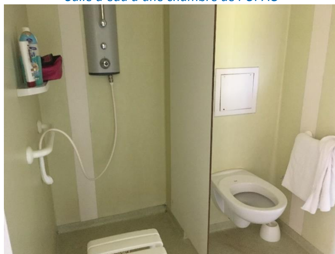
Salle d'eau d'une chambre de Loire D

Dans Maine B 3 et Maine B 4, aucune chambre n'est dotée de WC ; seules quelques chambres doubles sont dotées d'une salle d'eau avec douche à l'italienne et lavabo, et les autres chambres ont un simple lavabo placé dans un « cagibi » de moins de 2 m 2 , certains sans miroir. Ces deux unités disposent chacune de plusieurs WC collectifs au rez-de-chaussée et à l'étage, dont un par étage accessible aux personnes à mobilité réduite (PMR), et de deux salles de douches – une pour les femmes et une pour les hommes –, chacune composée de trois ou quatre cabines fermées dont une accessible aux PMR et, pour la salle qui n'a que trois cabines, une baignoire. Les douches