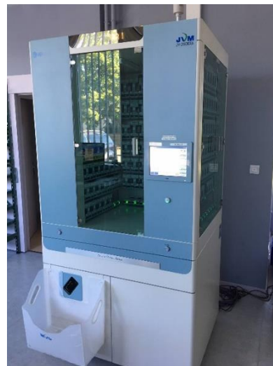
Automate conditionnant les prises par patient

La pharmacie à usage interne (PUI) livre deux fois par semaine aux unités la dotation globale d'urgence et les médicaments conditionnés en sachet individuel thermo-fermé transparent par prise. Le préparateur en pharmacie vient aider les IDE des unités d'admission pour les formes lyocs 16 et assurent la gestion de la dotation de dépannage.