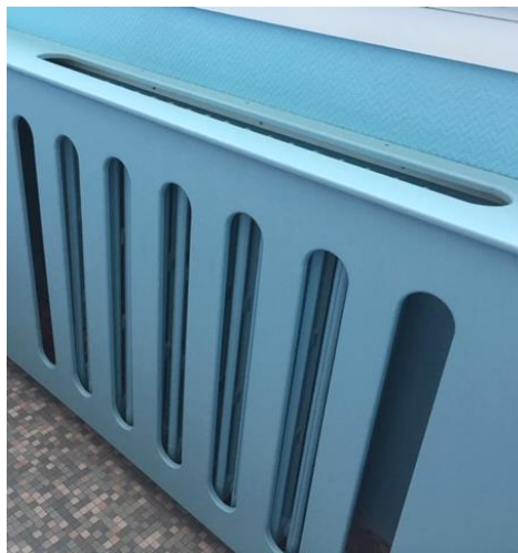
Protection de radiateur