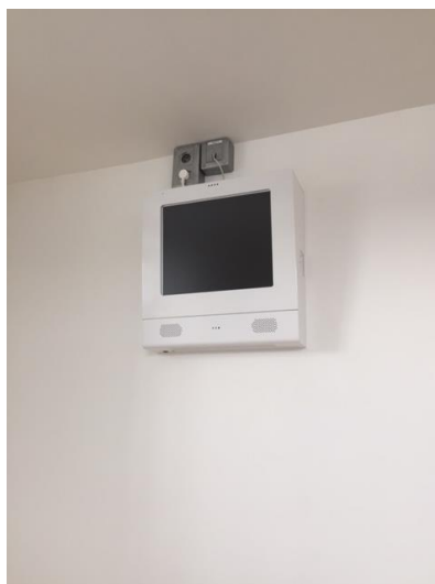
Poste de télévision en chambre

Les deux chambres sont dotées d'un poste de télévision fixé au mur et protégé, d'accès gratuit.