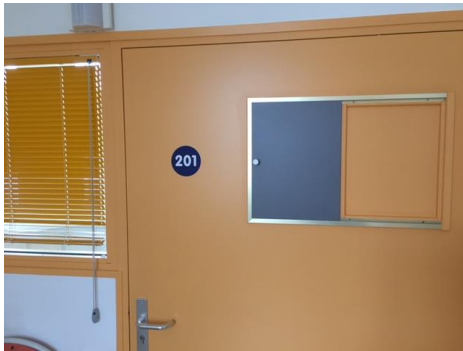
L'entrée d'une chambre sécurisée

Elles étaient, lors de la visite des contrôleurs, propres et bien entretenues.