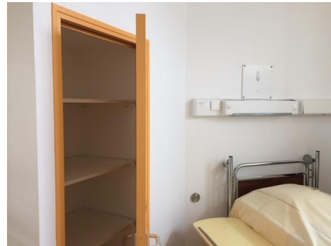
L'intérieur d'une chambre sécurisée

De grandes fenêtres, dotées de barreaux, permettent un éclairage naturel et une vue agréable sur l'environnement.