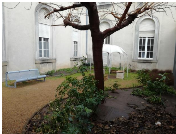
Cour accessible aux patients des chambres sécurisées