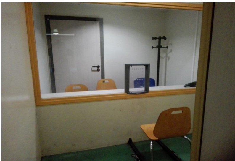
Le local avocat

Les engagements pris par le ministère de l'intérieur à la suite de la visite précédente du CGLPL, de remédier au manque de confidentialité des entretiens avec l'avocat, n'ont toujours pas été suivis d'effet. Une modification du local avocat doit être réalisée au plus tôt.