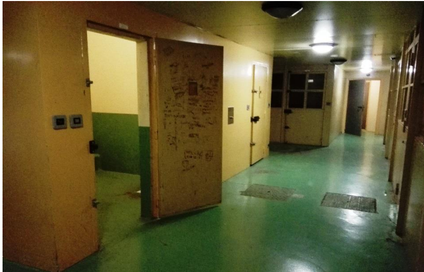
Les cellules de dégrisement

Les portes, pourvues d'une serrure de sûreté et de deux taquets, sont couvertes de graffitis.