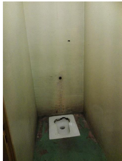
Une douche et un WC