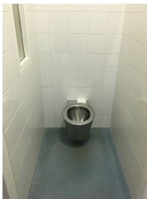
Chambre d'isolement et ses toilettes

Ces chambres sont toutes identiques ; toutes sont suffisamment spacieuses et comportent un affichage de la date et de l'heure. Elles disposent d'un bouton d'appel fixé sur le lit du malade, accessible lors des phases d'attachement. Il n'y a pas de bouton d'appel mural. Les chambres disposent d'un patio privatif pour deux chambres, accessible par une porte située dans l'espace entre les deux chambres d'isolement amenant également à la salle de douche. Celui-ci n'est jamais en accès libre. Une règle informelle autorise une cigarette quatre fois par jour pour les fumeurs.