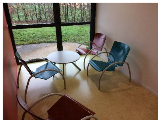
Le petit salon d'un ESPI

La directrice a indiqué aux contrôleurs être consciente de ces difficultés. La question du rapatriement des unités de Vienne sur le site berjallien conditionne à moyen terme la construction d'un bâtiment intersectoriel, plus important que la maison des usagers, et qui aurait notamment vocation à accueillir des espaces de rencontre entre les patients et leurs enfants ainsi qu'une véritable cafétéria.