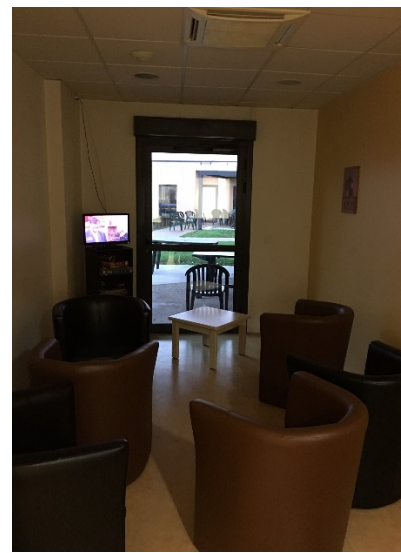
Salle de télévision

Les activités thérapeutiques, pourtant variées, ne sont pas suffisamment proposées aux patients qui ne les connaissent pas toutes ; il est d'ailleurs indiqué que ce sont les soignants qui proposent les activités en fonction des possibilités du personnel. La démarche ne vient ainsi pas du patient dans le cadre d'un projet de soin co-construit avec lui et intégrant les activités comme en en faisant totalement partie. Beaucoup de ces activités ne sont pas prescrites par le médecin en ce sens. Les soignants confirment ce positionnement en priorisant les activités dans l'unité où les patients restent longtemps (Airelles) et considèrent que dans les unités d'entrée, l'activité risque de freiner la sortie des patients. Un risque de « chronicisation » a été plusieurs fois évoqué à cet égard.