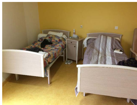
Chambre simple à occupation double