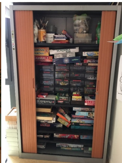
Armoire avec jeux de société