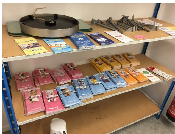
Documents à disposition des familles et usagers

Les usagers peuvent avoir accès à un certain nombre d'informations et de brochures. La MDU organise prochainement une journée « portes ouvertes » à l'occasion de la semaine d'information à la santé mentale.