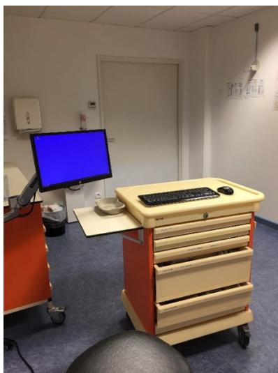
Chariot à médicament permettant la dispensation en salle de pharmacie d'une unité

Une commission du médicament et des dispositifs médicaux stériles (COMEDIMS) est en place au sein de l'établissement et se réunit plusieurs fois par an. Son fonctionnement est cependant freiné par l'absence fréquente des deux médecins. La réunion du 20 septembre 2018 avait à l'ordre du jour un travail sur le nombre d'erreurs médicamenteuses déclarées trop faible au sein de l'ESMPI.