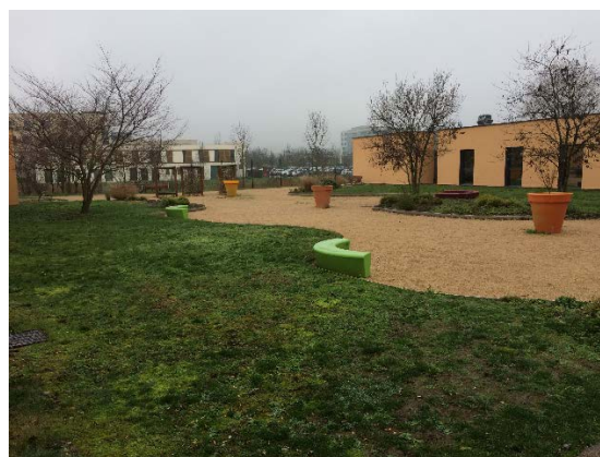
Le parc du site berjallien

Son enceinte est entièrement grillagée. Un point d'accès unique le dessert, avec une entrée pour piétons, libre, et une entrée véhicules dotée d'une barrière. Celle-ci est toujours rabaisée : l'accès n'est possible qu'après avoir obtenu l'autorisation par interphone. Une fois qu'il a pénétré dans le site, le visiteur doit se présenter à l'entrée principale, ouverte jusqu'à 20h (avec la présence d'une salariée, chargée de l'accueil et du standard, de 8h30 à 16h30). Il n'est pas possible au visiteur de circuler à l'intérieur du site s'il n'est pas rentré par la porte principale : les autres espaces (parking du personnel et accueil livraisons au Nord ; unités et parc au Sud) sont protégés par un grillage intérieur. L'ESMPI emploie un agent de sécurité, présent jusqu'à 20h tous les jours. Il n'existe pas d'équipe d'intervention composée de soignants. Face à un patient violent, notamment en service de nuit, les soignants des unités s'appellent et s'entraident. Lorsqu'ils estiment ne pas être en nombre suffisant ou en capacité de maîtriser un patient particulièrement agressif, ils n'hésitent pas à faire appel à la police.