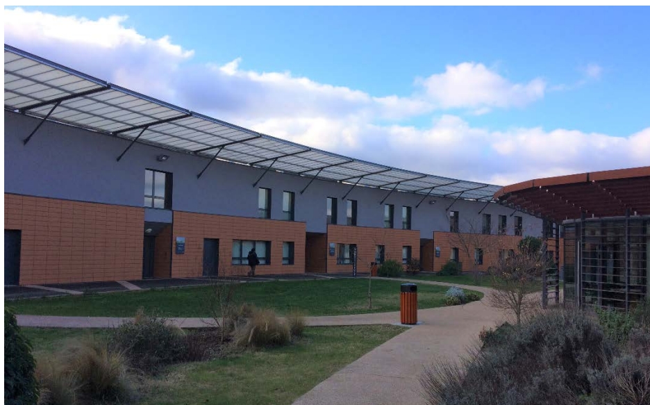
Le bâtiment des unités, desservi par une allée extérieure en arc de cercle

Les locaux qui hébergent l'ESMPI ont été construits en 2009 et sont très bien entretenus. Les unités sont situées au rez-de-chaussée d'un bâtiment en forme d'arc de cercle, ouvert sur un espace vert ; les locaux administratifs se trouvent au premier étage. Ils sont clairs et fonctionnels.