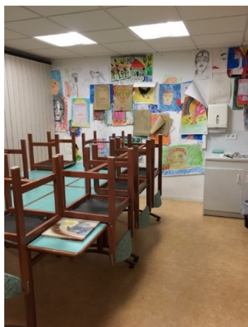
Salle d'activité d'une unité