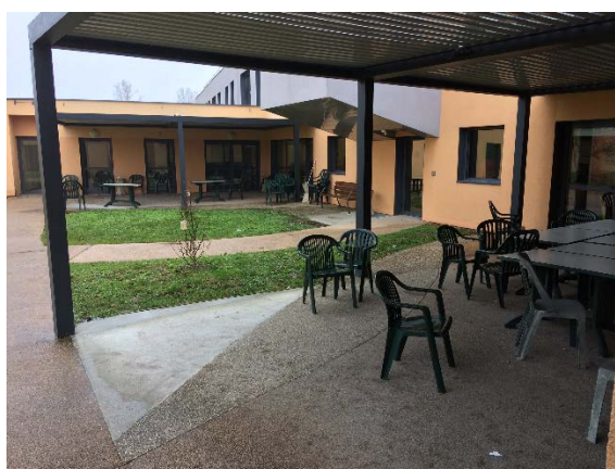
L'arrière des unités et le patio

Les patients peuvent se promener librement et atteindre un second parc à l'arrière du bâtiment, en passant par un patio protégé des intempéries.