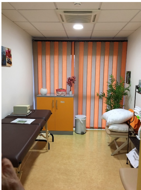
Salle « zen »

Deux unités ont agencé une salle de détente associant massage, musique et soins esthétiques. Ces salles « zen » sont équipées d'une table de massage, qui peut être utilisée par les patients accompagnés d'un soignant.