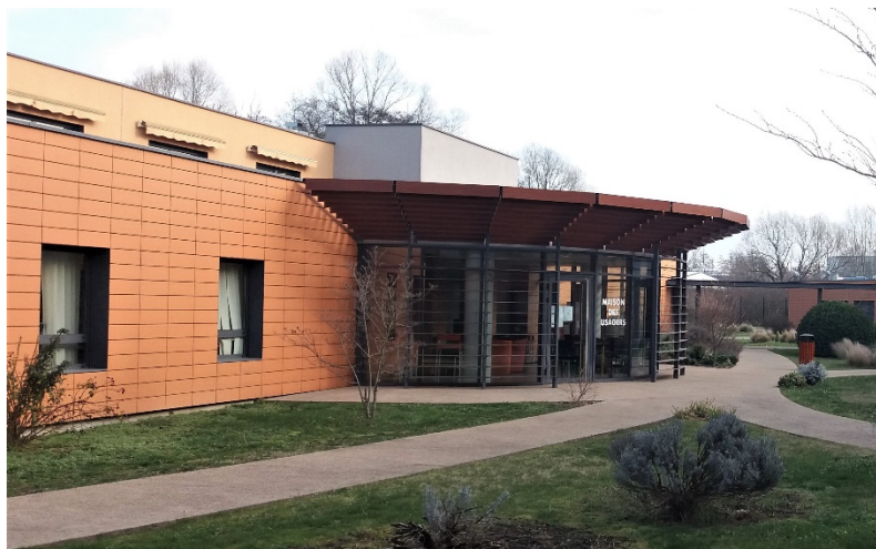
Vue extérieure de la maison des usagers

C'est un lieu récemment ouvert trois demi-journées par semaine, à l'occasion de permanences d'accueil organisées avec deux groupes d'entraide mutuelle (« Oxygem » et « l'abeille vie », trois jeudis par mois de 14h à 16h), ou avec des membres de l'UNAFAM (deux fois par mois l'après-midi) ou enfin avec l'assistance sociale coordonnatrice de cette maison des usagers. Des activités jeux et loisirs créatifs sont organisées par l'un des deux groupes d'entraide une fois tous les quinze jours, pour environ vingt patients.