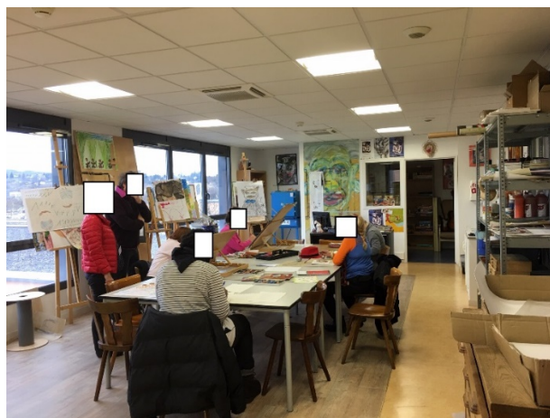
Salle d'art-thérapie inter-unités

L'activité « repas thérapeutique » comprend la définition d'un menu et la réalisation des courses avant de préparer le repas, avec une infirmière et une aide-soignante.