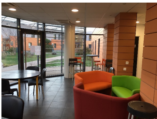
La maison des usagers

Il est à noter que les familles ne peuvent se rendre dans les chambres qu'aux Bleuets. Dans les trois autres unités, cette hypothèse est exclue : ce refus faisait, au moment du contrôle, l'objet d'une réclamation de la famille d'un patient des Airelles auprès de la CDU.