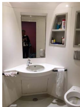
Chambre et sanitaires individuels