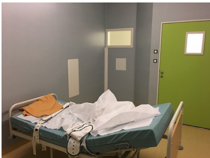
Chambre d'isolement des urgences