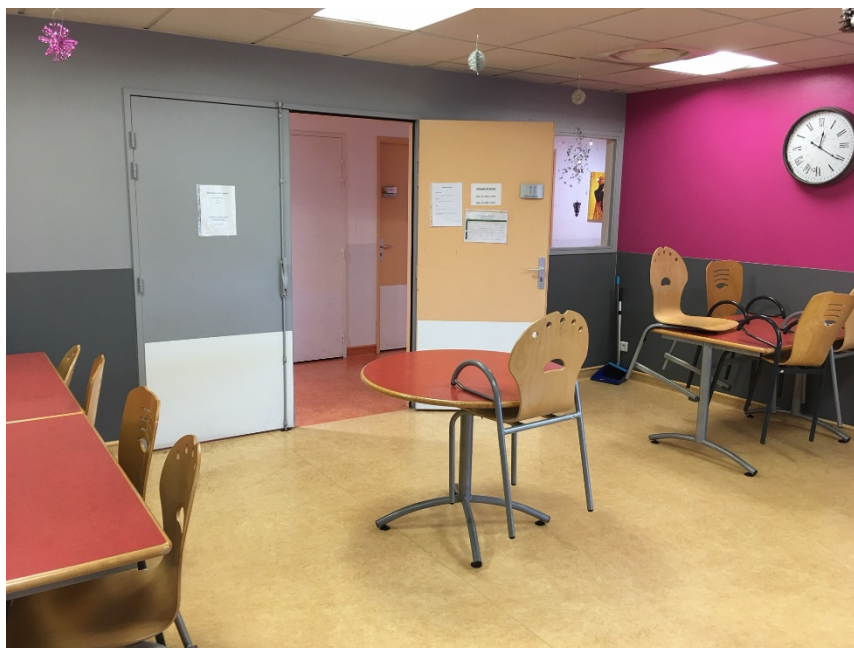
Salle à manger d'une unité

Des repas thérapeutiques sont organisés une fois par semaine ; les patients désignés y consacrent leur matinée en élaboration du menu, courses et préparation du repas ; ils peuvent inviter une personne – soignant ou personne hospitalisée – pour partager ce moment. En dehors de ce temps particulier, les soignants ne partagent pas le repas avec les patients. La configuration des locaux ne le permet pas : la salle ne peut accueillir que vingt-six personnes assises.