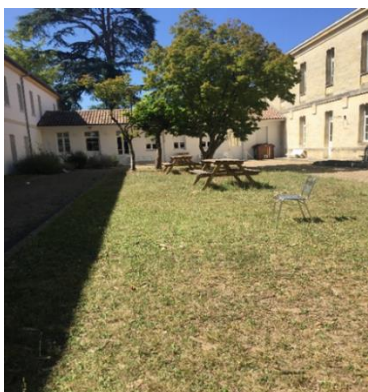
Cour de l'unité Trelat-Marguerite

En journée, les patients ont accès à des cours arborées ou des patios équipés de tables et chaises ou bancs, où ils peuvent fumer.