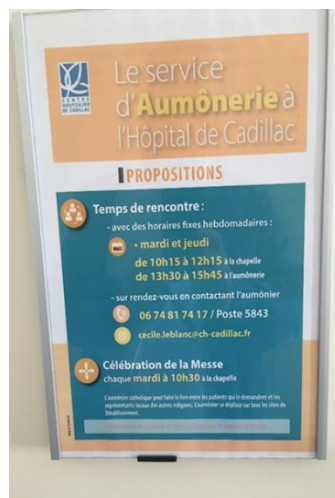
Affiche sur la porte de l'aumônerie

Selon les informations fournies, les demandes émanant des patients sont pratiquement inexistantes. Seul le culte catholique est représenté par une aumônière qui est présente deux jours par semaine au sein de l'hôpital. Elle dispose d'un local où ont lieu des groupes de parole. La messe, qui a lieu tous les mardis dans la chapelle de l'hôpital, est célébrée par un prêtre. Les patients qui souhaitent y assister sont pris en charge par l'aumônière. Cette dernière se rend dans les unités pour aller les chercher.