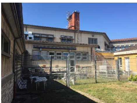
La petite cour de l'USIP

L'unité de soins intensifs psychiatriques (USIP) est sise sur l'emprise de l'unité pour malades difficiles (UMD) et constitue un des services du pôle de psychiatrie médico-légale avec les cinq entités de l'UMD et la sismothérapie. L'USIP est une unité fermée, uniquement dotée de 13 CI, dont une double, sommairement équipées d'un lit scellé au sol avec du matériel de contention préinstallé, d'un pouf, d'un lavabo et d'un WC, sans placard ni bouton d'appel. L'unité ne dispose d'aucune chambre d'hospitalisation hôtelière ni d'espace d'apaisement. Un maximum de 14 patients peut y être accueilli mais en général seuls 12 y sont pris en charge car la chambre double est rarement utilisée. Les chambres sont réparties entre le rez-de-chaussée et l'étage, où se situe le bureau infirmier. L'unité est aussi dotée d'un réfectoire, de quatre salles d'eau (dont une condamnée depuis plusieurs mois en raison de moisissures), d'une pharmacie, de bureaux d'entretien et d'une buanderie pour laver et sécher le linge des patients. Les locaux sont dans l'ensemble propres et bien tenus. Deux cours à l'aspect carcéral permettent aux patients de prendre l'air, uniquement en groupe sous la surveillance des soignants. Une sert pour le groupe, l'autre pour les patients isolés ou les proches lors des visites. Certains agents indiquent « des vertus thérapeutiques de cette structure contenant ».