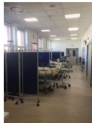
Salle de réveil ECT