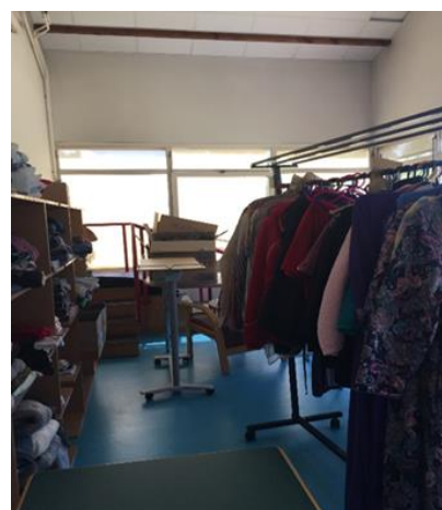
Stock de vêtement de dépannage