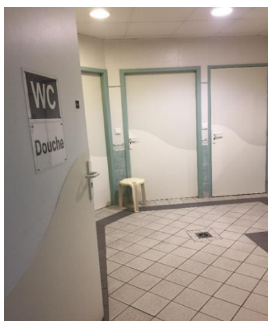
Douches collectives d'une unité

Dans ses observations du 30 janvier 2024, le directeur de l'établissement indique : « le règlement de fonctionnement de l'unité Tosquelles a été corrigé pour ne plus faire mention d'un prestataire de lingerie. Un audit sera réalisé sur les modalités de prise en charge du linge patient au sein des unités d'hospitalisation complète. »