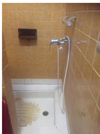
Douche de l'unité Pinel