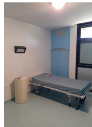
CS unité Tosquelles

Il n'y a pas d'espace d'apaisement dans chaque service comme prévu par l'article D 6124-265 du CSP.