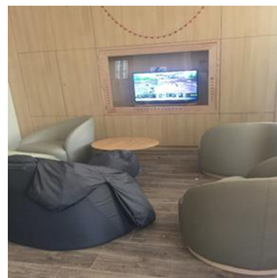
Salon d'une unité