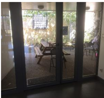
Patio d'une unité