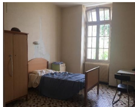
Chambre simple de l'unité Pinel