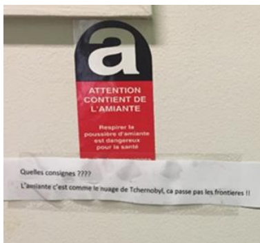
Porte du bureau des infirmiers condamné de l'unité Pinel