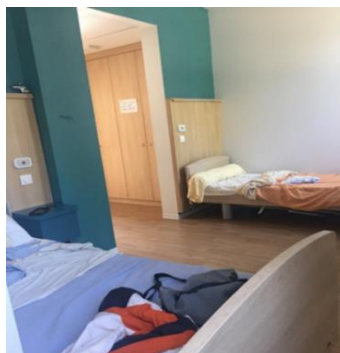
Chambre double unité rénovée

Les chambres collectives doivent disposer d'un nombre de tables, chaises et placard correspondant au nombre des occupants.