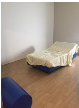
CI unité Trélat

Dans ses observations du 30 janvier 2024, le directeur de l'établissement indique « l'établissement est engagé depuis l'année 2022 sur un plan de mise en conformité des CI. Comme indiqué dans le rapport annuel 2022 sur l'isolement et la contention et repris dans le présent rapport, plusieurs aménagements ont été réalisés sur les années 2022 et 2023 pour la mise en conformité des CI, à la fois en termes de travaux et d'équipements (achat de mobilier adapté) pour un montant global de plus de 450 000 euros d'investissement sur ces deux années. Sur la base d'un nouvel audit de l'ensemble des CI de l'établissement réalisé en juin 2023 par la direction technique, une nouvelle enveloppe de 300 000 euros consacrés à l'isolement contention a été budgétée au sein du plan d'investissement 2024-2025 afin de poursuivre ces aménagements. Ainsi il est prévu d'équiper toutes les chambres d'isolement de système d'appel malade et d'un nouveau dispositif d'orientation temporelle au cours du 2 ème semestre 2024. Une commande a été effectuée en décembre 2023 pour équiper l'ensemble des CI d'un système d'éclairage réglable. Il est également prévu l'installation d'un dispositif de fermeture des oculus présents sur les portes des chambres d'isolement. »