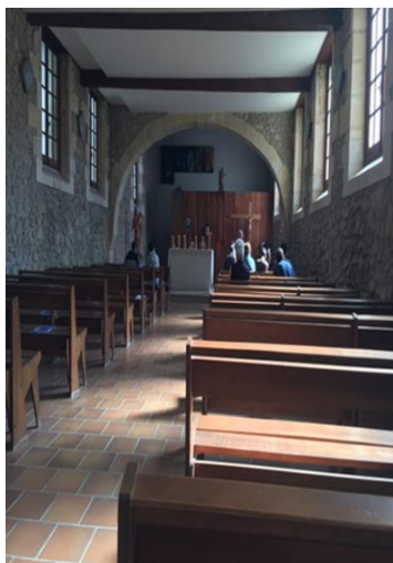
Messe dans la chapelle

orthodoxe et protestant). A la demande du patient, chaque représentant des divers cultes peut être contacté par le personnel soignant.