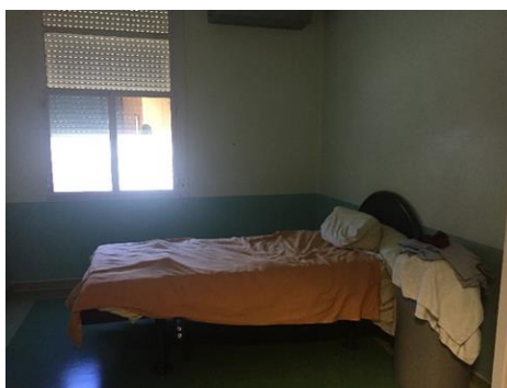
Chambre de l'USIP