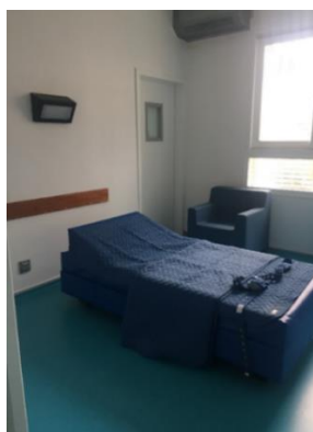
Chambre d'isolement de l'unité Parchappe

Des urinaux sont donnés aux patients qui ne sont pas toujours amenés aux WC, y compris durant la journée et il est fréquent de voir les contentions préinstallées sur les lits.