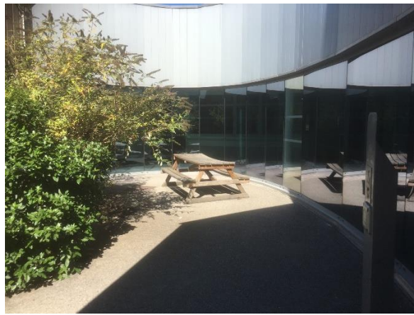
Intérieur du site du CHS de Cadillac