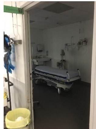
Box spécifique pour personne agitée

Les patients agités étaient amenés, avant la pandémie, directement à l'intérieur des urgences via le sas des ambulances, à proximité du bureau de l'infirmier organisateur de l'accueil (IOA). Depuis la pandémie, cet accès est réservé aux patients potentiellement infectés et les autres patients transitent tous par l'entrée principale où attend le public.