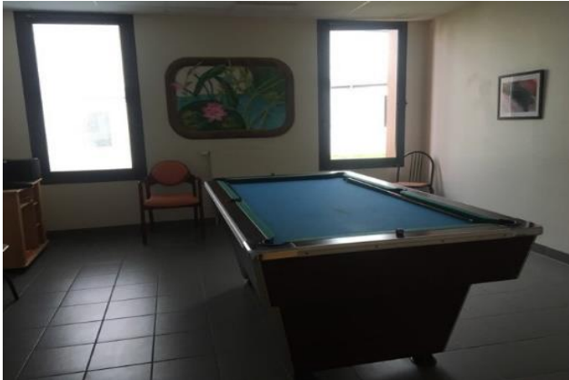
Salle de psychothérapie au sein de l'unité A munie d'un billard

Dans chaque unité se trouvent une salle d'activités (avec jeux de société, un baby-foot dans l'unité B), une ou deux salles de télévision, un espace fumeur (avec une télévision qui n'était pas en état de marche lors de la visite à la suite de dégradations commises par les patients), une salle de restauration, une salle de « psychothérapie adulte » équipée notamment d'un billard et un salon « famille ».