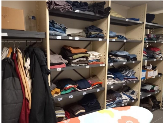
Vêtements de secours disponibles à l'unité A

Les unités possèdent en outre un vestiaire avec des vêtements disponibles pour les patients dépourvus d'effets personnels.