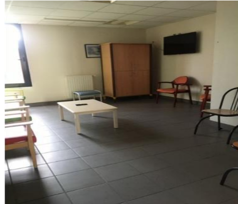
Salon de télévision dans l'unité A