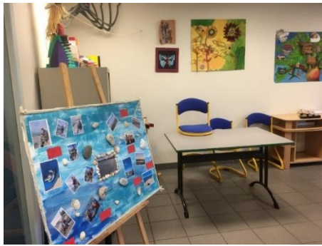
Salle de l'art-thérapeute