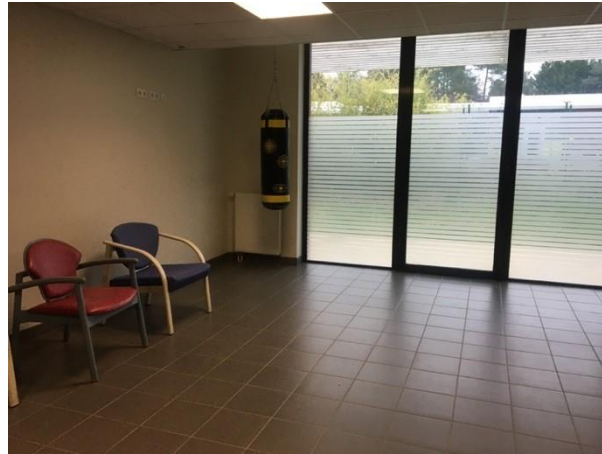
Salle d'activités de l'unité B équipée d'un sac de frappe

Une salle d'art-thérapie, très investie par les patients, est positionnée entre les deux unités. Ces deux unités présentent en outre des espaces extérieurs arborés et calmes. Un patio extérieur abrite un coin potager et des arbres fruitiers.