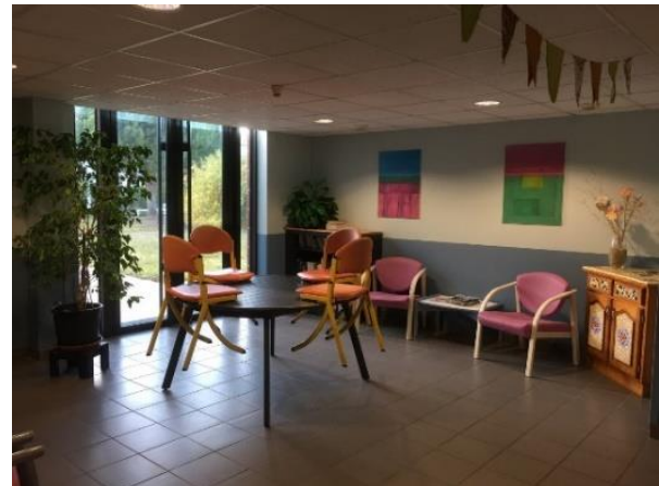
Salon avec jeux de société

Les unités du pôle disposent d'un budget de 10 000 euros pour les activités (repas thérapeutiques, sorties culturelles ou sportives, expositions, manifestations) et les soignants indiquent que cela permet l'exercice des missions ; l'art-thérapeute développe le recyclage de matériaux divers gracieusement donnés par de nombreux partenaires.