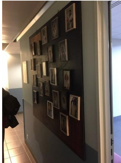
Cadres photo des soignants indiquant leurs fonctions

sont regroupées sur un grand tableau. Apparaissant comme un message de bienvenue, ces photos sont particulièrement appréciées des patients comme des visiteurs.