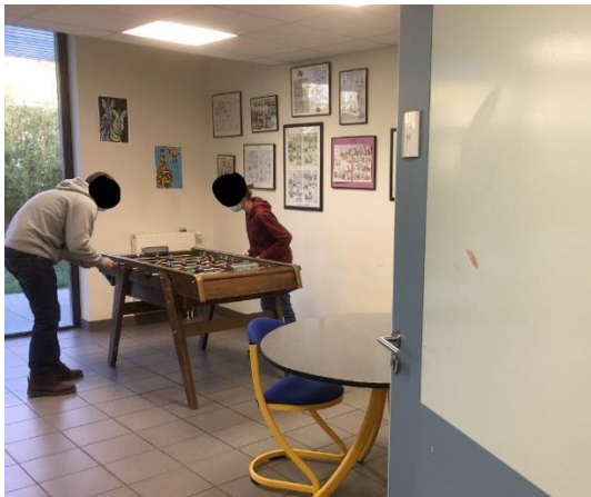
Patients jouant seuls au babyfoot

Les activités thérapeutiques sont intégrées au projet de soins et sont nombreuses. Les patients sont ainsi occupés chaque jour s'ils le souhaitent et un tableau dans le service recense l'ensemble des activités offertes : gymnastique, relaxation, groupes de parole, piscine, sport collectif, cuisine, randonnée, chorale, atelier d'expression. Une art-thérapeute est par ailleurs présente chaque jour et permet aux patients de venir passer deux heures, une à trois fois par semaine selon les souhaits des patients, dans une salle située au milieu des deux unités.