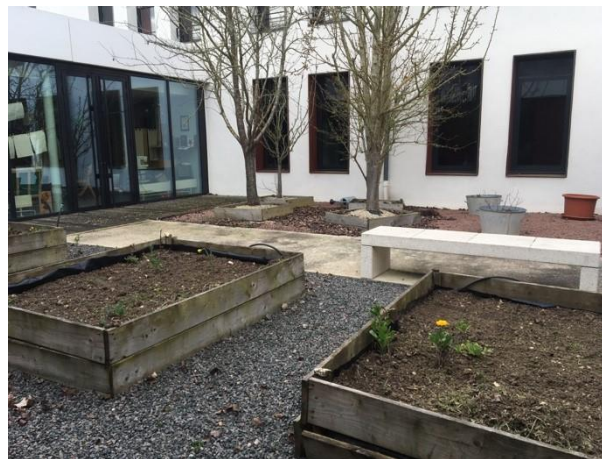
Patio extérieur de l'unité A avec des potagers

Une salle d'art-thérapie, très investie par les patients, est positionnée entre les deux unités. Ces deux unités présentent en outre des espaces extérieurs arborés et calmes. Un patio extérieur abrite un coin potager et des arbres fruitiers.