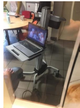
Patient en salle des infirmières

Les activités thérapeutiques sont intégrées au projet de soins et sont nombreuses. Les patients sont ainsi occupés chaque jour s'ils le souhaitent et un tableau dans le service recense l'ensemble des activités offertes : gymnastique, relaxation, groupes de parole, piscine, sport collectif, cuisine, randonnée, chorale, atelier d'expression. Une art-thérapeute est par ailleurs présente chaque jour et permet aux patients de venir passer deux heures, une à trois fois par semaine selon les souhaits des patients, dans une salle située au milieu des deux unités.