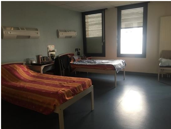
Chambre double de l'unité A

Les salles de bains disposent toutes de lavabos, douches et WC et peuvent être fermées par un verrou de confort.