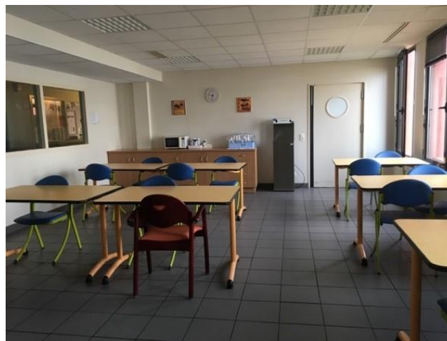
Salle de restauration de l'unité A

L'unité B dispose en outre d'une salle d'activités munie d'un sac de frappe.