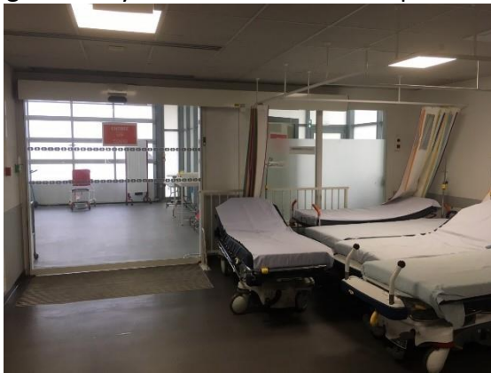
Entrée des ambulances aux urgences

Le service d'accueil des urgences (SAU) a assuré la prise en charge, toutes pathologies confondues, de 16 700 personnes en 2021 (adultes et enfants). Durant les deux premiers mois de l'année 2022, 29 personnes ont été hospitalisées en psychiatrie après un passage aux urgences. Il y en avait eu 271 les dix premiers mois de l'année 2021.