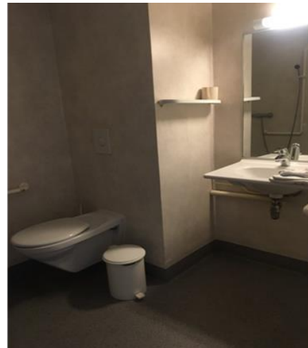
Sanitaire de l'unité A

Néanmoins, les placards dans les chambres ne peuvent être fermés à clé par les patients qui sont dans l'impossibilité d'y conserver leurs affaires en toute sécurité.