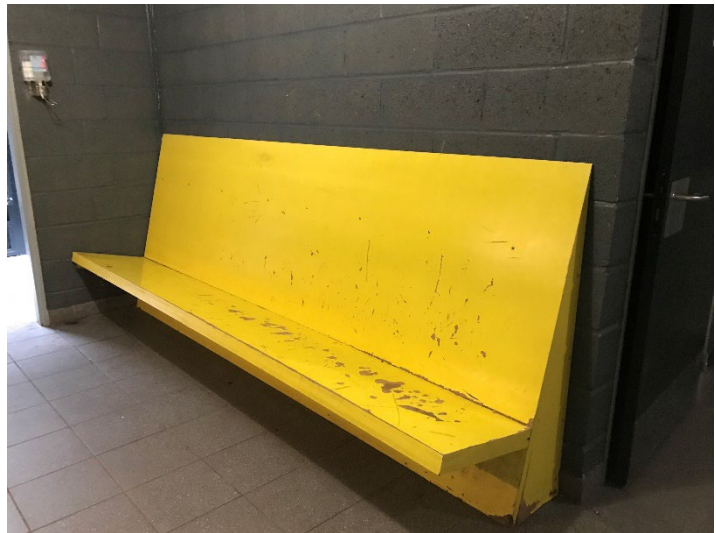
Le banc jaune du hall de la zone de sûreté

Les personnes sont placées dans la cellule dite d'attente ( cf. infra , § 4.2) – la plus proche du poste – dans le cas où l'OPJ qui notifie le début de la mesure n'intervient pas immédiatement. Si l'OPJ est déjà présent, la prise en charge débute sur le banc jaune situé dans le hall de la zone de sûreté. Si la personne est mineure, elle n'est pas placée dans la cellule d'attente.