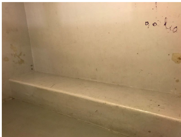
Banc et murs sales de la cellule d'attente

Les murs et le sol des cellules, décrits comme propres et ne comportant aucune inscription en 2012, présentent en 2022 des signes d'usure et quelques graffiti. Les mêmes signes d'usure sont observables sur la peinture jaune du banc du hall (cf. photographie supra § 4.1).