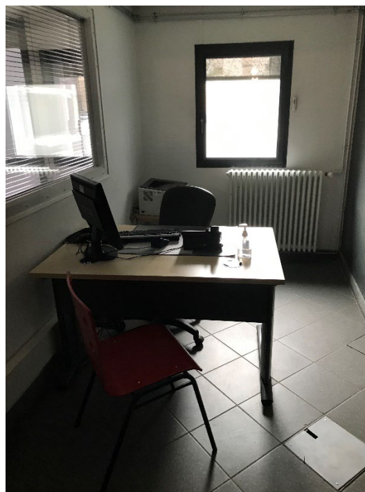
Le bureau d'audition