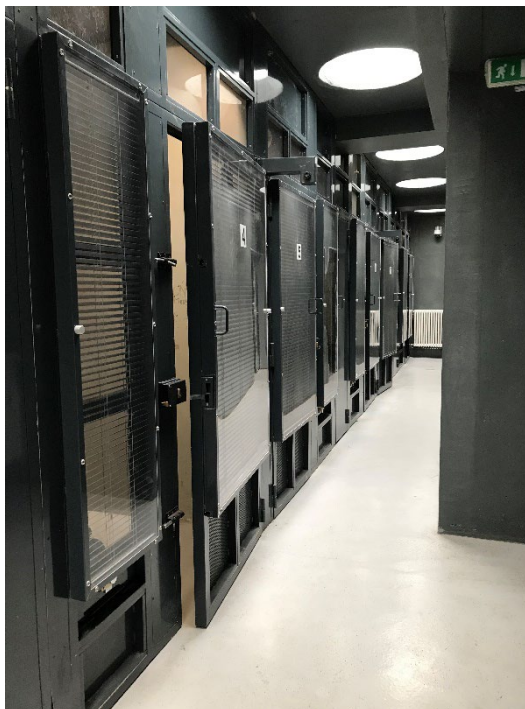
Le couloir où s'alignent les cellules

Outre la cellule d'attente située face au poste et ne comprenant qu'un banc en béton et des stores vénitiens sur la paroi vitrée, un couloir fermé par deux portes dessert sept cellules individuelles et une cellule collective.