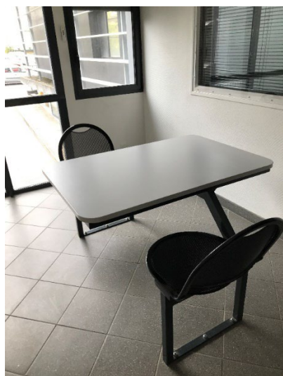
Le bureau avocat