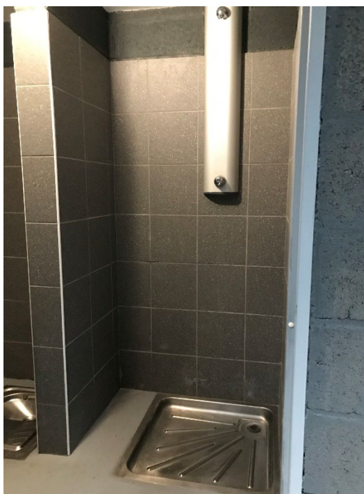
Le local sanitaire avec douche, WC et lavabo