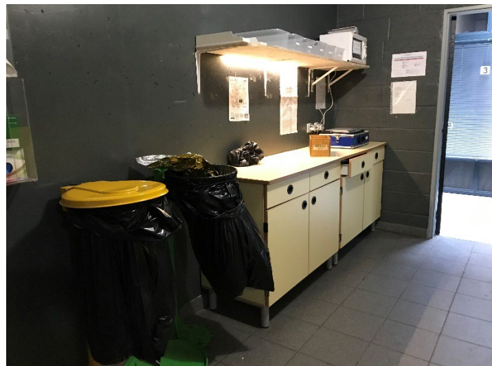
Le mobilier du hall

En face, des meubles permettent de procéder au retrait et à l'inventaire des effets personnels et de doter la personne des éléments matériels nécessaires avant placement en cellule (couverture, gobelet). Une explication est donnée sur le bon usage de la couverture de survie.