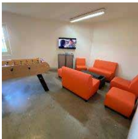
La salle d'activités