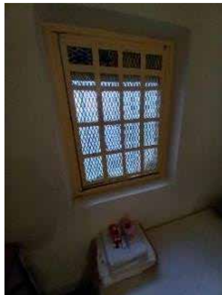
Fenêtre d'une cellule du QD

Le local de douches du QD est accessible trois fois par semaine (lundi, mercredi et vendredi). Il est constitué de trois douches avec portes pleines, dont une dotée de passes-menottes. Comme cela a pu être constaté ailleurs en détention, la peinture du plafond des douches est quasiment inexistante du fait de l'humidité chronique.