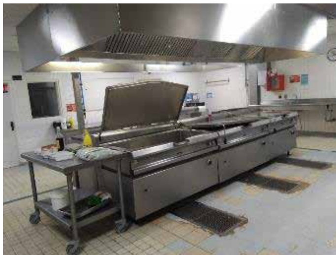
Vue de la zone de cuisson

Les locaux affectés à la cuisine souffrent d'une difficulté structurelle et sont apparus vieillissants et dégradés. Cette situation est parfaitement identifiée par la direction et soulignée dans deux rapports 24 . Deux options sont envisagées avec soit une rénovation complète, accompagnée d'une restructuration des locaux, soit une remise en état par reprise des sols, des revêtements muraux et des huisseries.