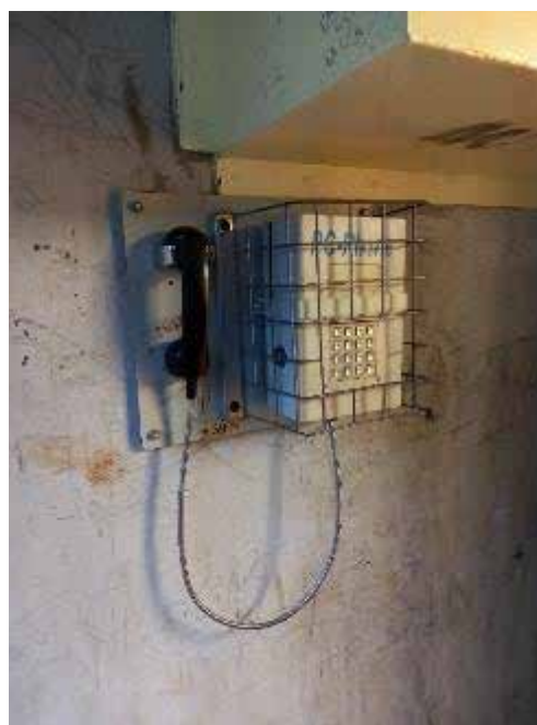
Cabine téléphonique dans une des cours de promenade du QD

Le QD comprend également un local de fouilles ( cf. infra § 6.3), la salle de CDD ( cf. supra ), et un local de stockage des effets personnels des personnes punies. Les punis peuvent faire nettoyer gratuitement leur linge par la buanderie une fois par semaine. Un réfrigérateur, situé dans le bureau des surveillants, permet de stocker les éventuels produits frais cantinés avant le placement au QD, qui sont remis aux personnes détenues par le surveillant. 43