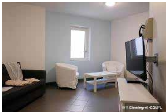
Unité de vie familiale

maximale d'accueil dans un parloir familial est de trois personnes, adultes ou enfants, dont la personne détenue.