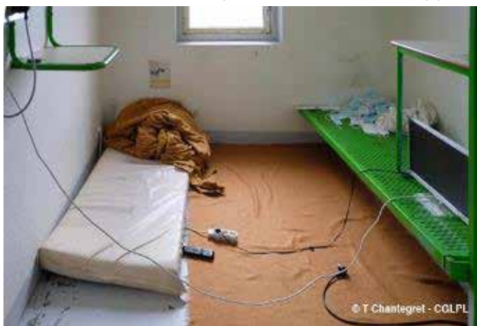
Vue de la cellule du détenu

« profils ayant effectué des démarches ». Les contrôleurs ont également constaté une très forte demande de la part des personnes détenues pour changer de bâtiment et accéder à un régime carcéral moins contraignant. Il semble que leur maintien ne soit pas forcément lié à une période d'observation insuffisante ou à des critères qui ne seraient pas remplis mais à la gestion du flux (cf. supra § 3.6). De même, certaines personnes détenues seraient éligibles à un changement de régime mais la proximité de leur libération, peut conduire à les maintenir dans la mesure où elles ne seraient pas considérées comme prioritaires. Il est apparu que certaines étaient présentes au-delà du délai d'observation précité – deux y étaient maintenues depuis un an – mais aussi que certaines avaient réintégré le bâtiment pour motif disciplinaire. Dès lors, pour ces dernières, la question de leur temps de présence et des critères devant prévaloir pour un retour à un régime conforme à celui d'un centre de détention se posent. Or, ceux-ci n'apparaissent pas clairement.