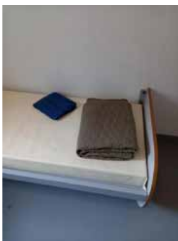
Dotation de protection d'urgence prédisposée dans l'une des deux CProU

Les placements en CProU s'accompagnent du recours aux dotations de protection d'urgence (DPU), composées d'un pyjama déchirable et d'une couverture indéchirable.