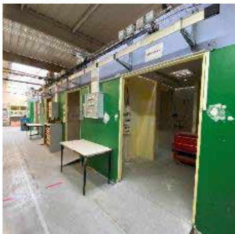
Zone de formation électricité

Les conditions de déroulement de la formation professionnelle n'appellent pas d'observations particulières. La formation professionnelle se déroule dans les locaux de l'ULE pour la partie théorique et dans une zone proche des ateliers possédant le matériel pour la formation pratique en cuisine et électricité. Les salles sont propres et bien équipées.