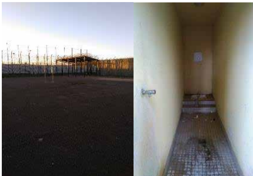
Cour de promenade - Toilettes et point d'eau situés dans le sas d'accès