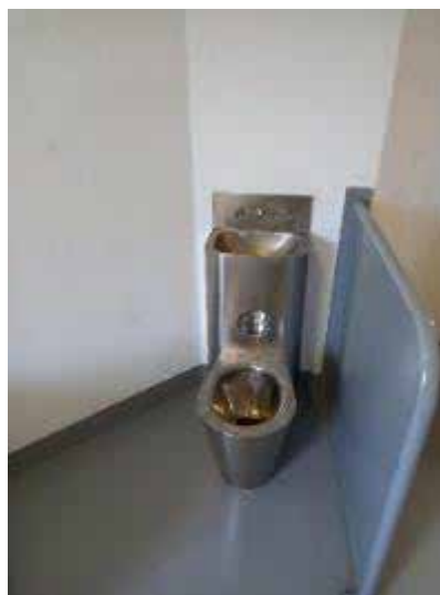
Vues d'une des deux CProU

Les placements en CProU s'accompagnent du recours aux dotations de protection d'urgence (DPU), composées d'un pyjama déchirable et d'une couverture indéchirable.