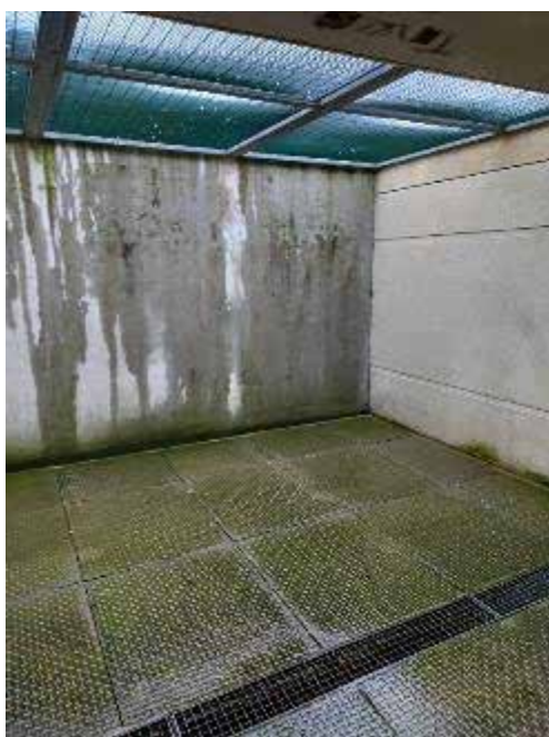
Une des cours de promenade du QD

Les personnes détenues placées au QD ont la possibilité de téléphoner quotidiennement durant leur heure de promenade ce qui leur permet de maintenir les liens familiaux et contribue à prévenir le risque suicidaire.