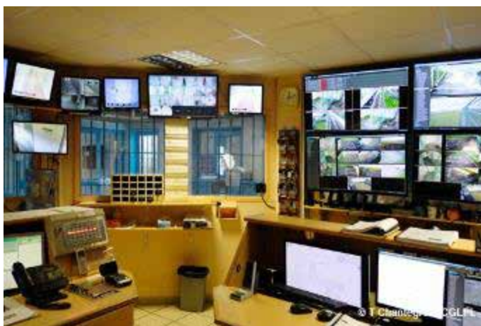
Vue partielle des écrans de surveillance du poste central et d'information (PCI)

Le centre de détention de Châteaudun dispose, à l'instar d'autres établissements, d'un système de vidéosurveillance articulé autour d'un poste central et d'information (PCI), de la porte d'entrée principale (PEP), d'un poste de contrôle et de circulation (PCC) et des postes d'information et de contrôle (PIC) des bâtiments auxquels s'ajoutent des moniteurs sur certains secteurs géographiques 36 . Depuis la première visite effectuée en 2010, le système de vidéosurveillance a été développé et modernisé avec l'ajout de caméras supplémentaires et de serveurs de nouvelle génération. Ainsi, le nombre de caméras de 173 en 2010, a été porté à 282 en 2019. Il atteindra 425 à l'issue du déploiement en cours d'achèvement. Les cours de promenade sont placées sous vidéosurveillance depuis 2016. Toutes les caméras en service, dont la maintenance est assurée par le prestataire du marché délégué, étaient opérationnelles à la date de la visite.