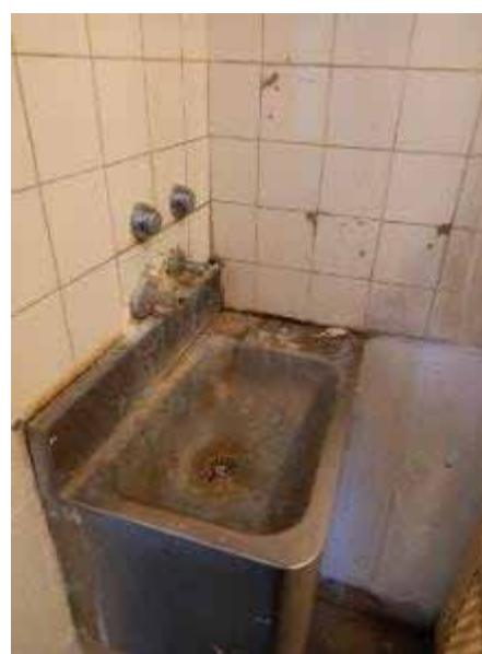
Vues des sanitaires de cellules de QD

Le plafonnier est situé dans le sas, tout comme son bouton de commande très difficilement accessible depuis la cellule au travers du grillage sinon en utilisant un manche de brosse à dent. Il en est de même du bouton de l'interphonie, reliée en journée au bureau des surveillants du QD/I et la nuit au PCI.