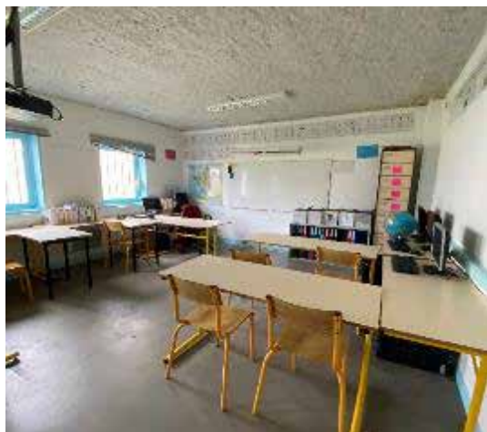
Salle de cours