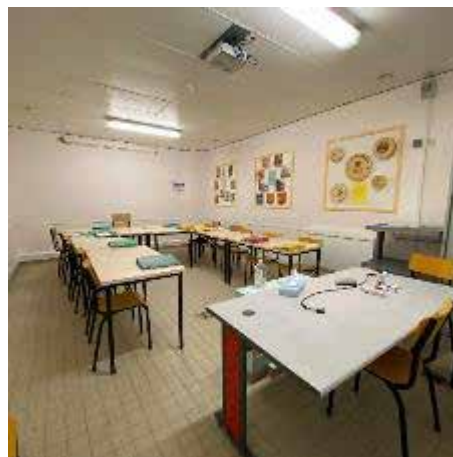
Salle de formation professionnelle

Il est établi au travers des documents consultés par les contrôleurs que les personnes bénéficiant d'une formation professionnelle perçoivent effectivement la rémunération prévue par contrat, soit 2.49 euros de l'heure.