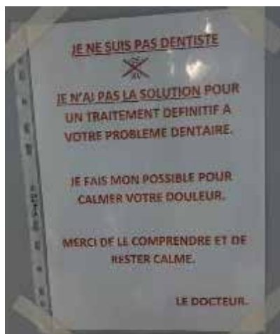
Affiche apposée sur la porte du bureau du médecin de l'USMP

Selon les informations recueillies auprès de la direction du CH de Châteaudun, plusieurs pistes seraient à l'étude pour pallier ce déficit de dentiste, mais sans échéancier connu.