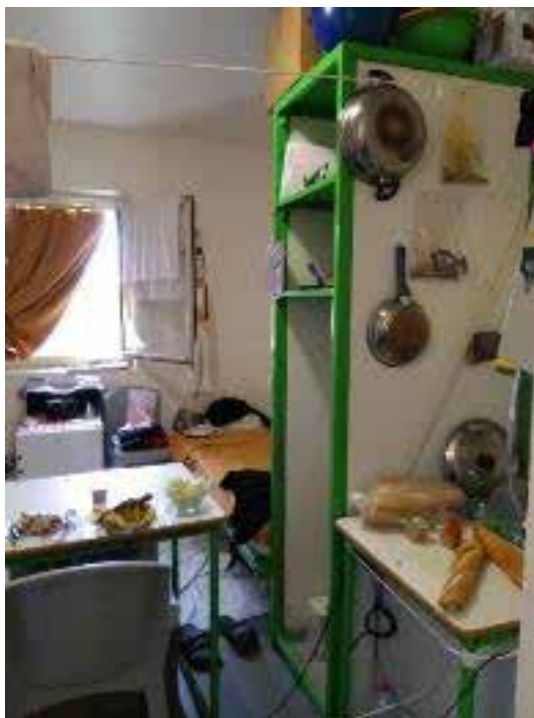
Vue partielle d'une cellule double.

Deux cours de promenade sont accessibles. Elles disposent d'un abri sous forme d'auvent et depuis la dernière visite, d'une barre de traction. Il n'existe pas d'autre équipement comme des bancs ou des tables, ce qui laisse peu de possibilité pour se distraire. Aussi, l'observation formulée lors du précédent rapport quant à l'installation de bancs est-elle réitérée 12 . On y trouve un espace avec toilette à la turque et un robinet à pression à l'entrée. L'état d'entretien du lieu n'incite pas à s'y rendre et, de plus, il n'est pas accessible librement car dans un sas fermé après l'entrée en promenade. Une solution est à rechercher pour permettre l'accès libre à un lieu d'aisance. Un point d'eau indépendant destiné à se désaltérer devrait également être installé.