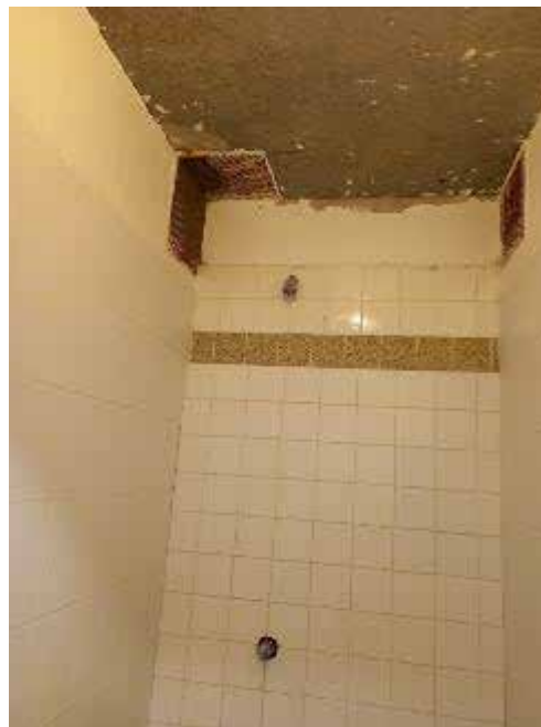
Local de douche et plafond d'une des douches du QD

Le QD compte deux cours de promenade, d'environ 25 m 2 chacune, totalement bétonnées, comprenant une partie en préau et une partie surmontée d'un grillage. Ces cours n'offrent aucune possibilité de s'asseoir ni de pratiquer la moindre activité physique.