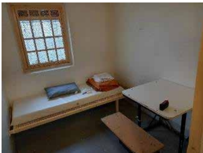
Vues d'une cellule du QD et de son sas