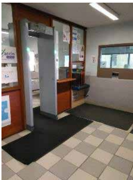
Accès avant passage sous le portique de sécurité

L'accès à l'établissement se fait par la porte d'entrée principale (PEP). Les lieux, tels qu'ils sont décrits dans le premier rapport de visite, n'ont pas évolué. Un auvent permet aux visiteurs d'être abrités des intempéries. Toute personne pénétrant dans le centre de détention passe par le portique de détection des masses métalliques et ses bagages soumis à l'examen du tunnel de détection.