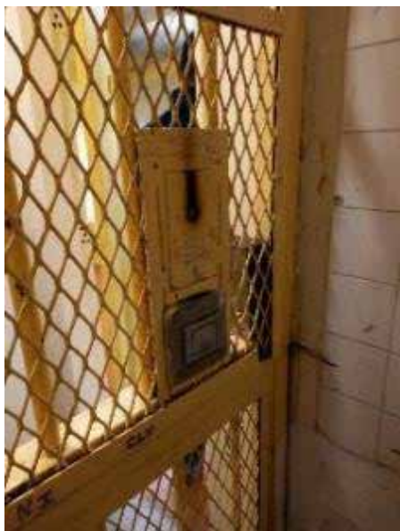
Allume-cigare ; derrière le métal déployé, bloc interrupteur et interphone