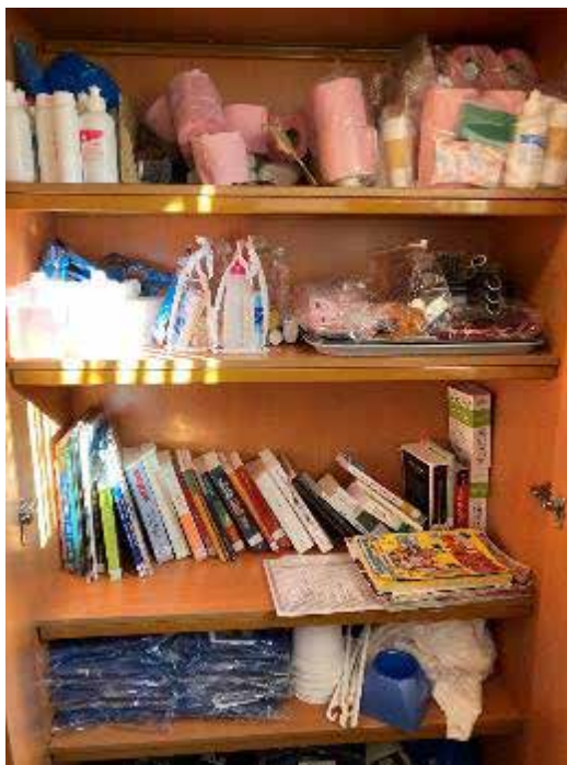
La bibliothèque de l'UDV

La bibliothèque consiste en une étagère comprenant moins de quarante livres, et quelques magazines en mauvais état. Les détenus peuvent emprunter trois livres pendant quinze jours à l'aide d'un formulaire.