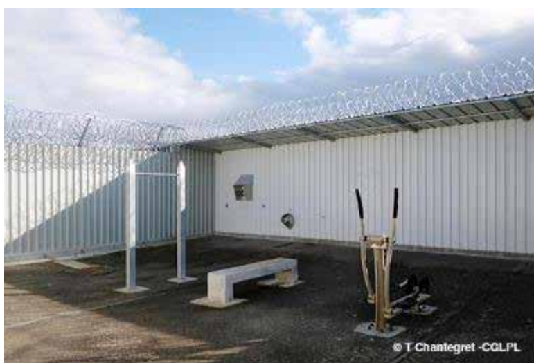
Une cour de promenade

Elles sont équipées d'un téléphone, d'un banc, d'un urinoir, d'une barre de traction et d'un appareil de sport.