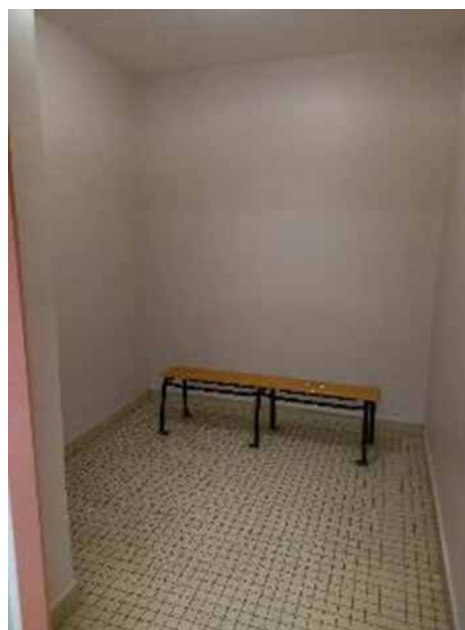
Vues de la salle de soins et de la petite salle d'attente