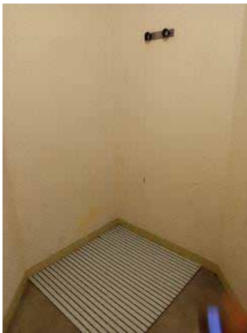
Local de fouille du QD/I

Il existe des locaux de fouille au niveau du greffe, du parloir, de l'UDV, du QD/I et à chaque étage des bâtiments de détention. Ces locaux sont partiellement adaptés (il manquait par exemple une chaise dans le local de fouille du QD/I, aussitôt ajoutée lorsque les contrôleurs l'ont relevé). Les fouilles ont prioritairement lieu dans ces locaux.