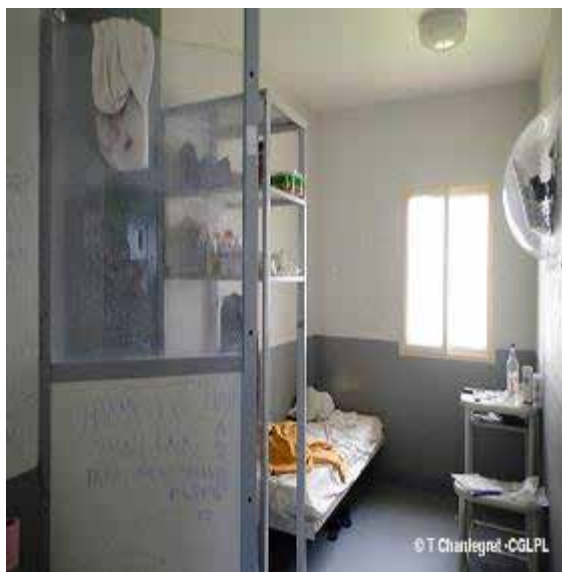
Equipement d'une cellule de l'UDV

Dans les cellules, les travaux de sécurisation ont impliqué la mise en place d'un passe-menottes sur chaque porte, et la fixation au sol des meubles (table et chaise) et du lit. La télévision n'est pas visible lorsque l'on est attablé, mais uniquement depuis le lit. La moitié des télévisions comporte un globe en plexiglas qui gêne la visibilité. Une douche a été aménagée. Il n'y a pas de téléphone en cellule comme dans le reste de la détention – à l'exclusion du QD. Un système d'interphonie relie les cellules au bureau des surveillants.