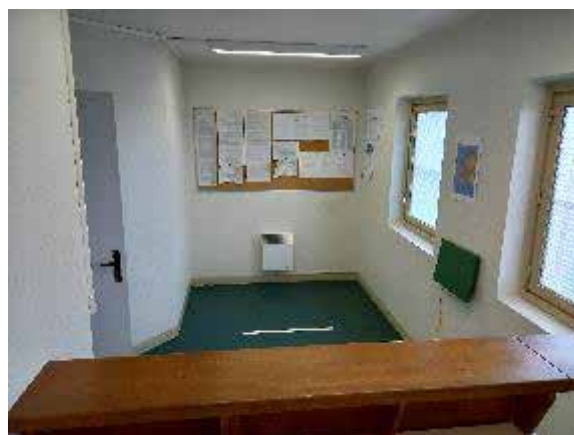
La salle de commission de discipline

Les affichages réglementaires (délégations, échelle des sanctions, tableau de l'ordre des avocats) sont présents et actualisés.