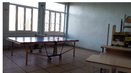
L'intérieur du bâtiment C : à gauche, la salle de musculation ; à droite : une salle d'activités