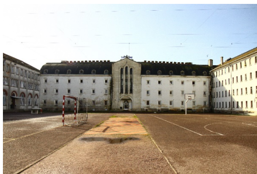
La cour principale : au fond, le bâtiment A ; à droite, le bâtiment B

Les douches sont collectives et accessibles en permanence durant l'amplitude d'ouverture des portes des cellules. Habituellement, il existe 10 cabines de douches mais, au moment des VSP, seules 9 étaient en activité (ce nombre a même été réduit à 2 pendant plusieurs mois en 2020 à la suite de dégradations et des travaux subséquents). Ces cabines peuvent être verrouillées de l'intérieur.