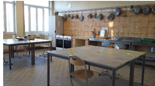
L'intérieur du bâtiment C : à gauche, un couloir ; à droite : une des cuisines - salles à manger