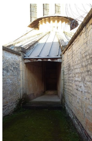
Une cour de promenade individuelle affectée au régime « portes fermées » au bâtiment A