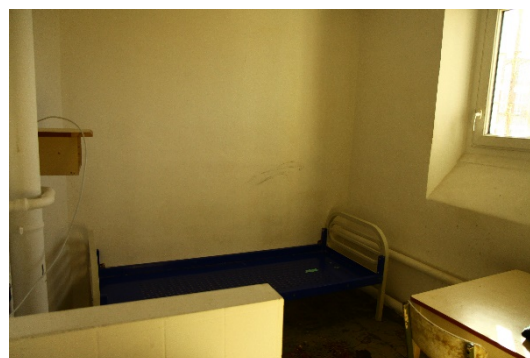
Une cellule individuelle du bâtiment A