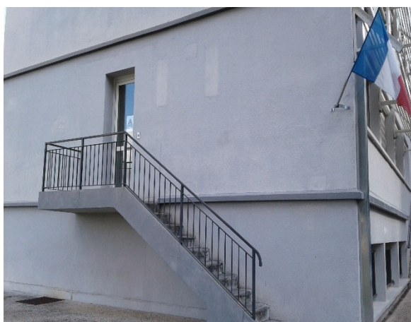
Bâtiment en zone fermée

Les locaux du bâtiment principal ont peu évolué depuis la précédente visite, en 2015. Cependant, des aménagements ont été réalisés afin de faciliter la prise en charge des jeunes. Les contrôleurs ont pu constater quelques changements : travaux de rénovation de certaines salles, réfection du revêtement des sols, rafraîchissement des murs et des plafonds.