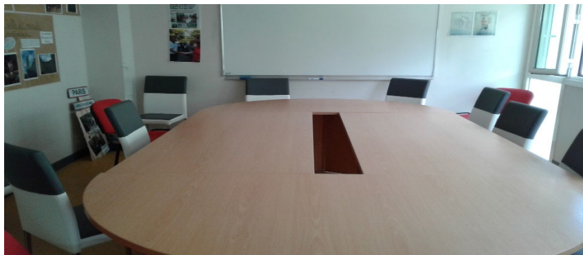
Salle de réunion

Les jeunes rencontrés pendant la visite considèrent qu'ils sont bien accueillis et qu'ils bénéficient d'une bonne information sur le fonctionnement de l'établissement.