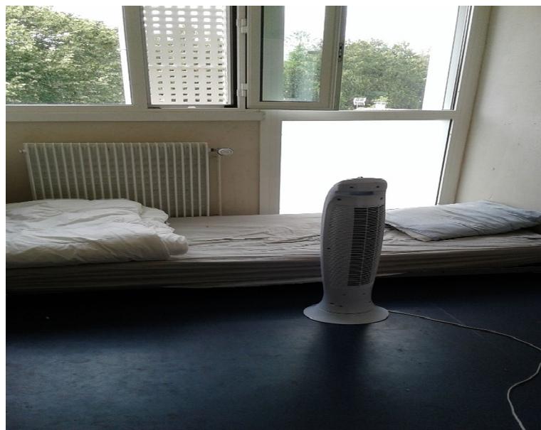
Chambre de mineur

Aucune chambre n'est équipée d'un verrou intérieur, et les jeunes ne disposent pas de la clé de leur chambre. Les chambres sont fermées par les éducateurs pendant les heures de cours ou d'activité.