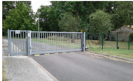
Entrée du CEF

Une ligne de bus s'arrête à proximité de l'établissement.