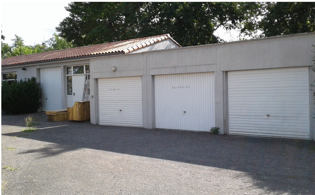
Bâtiment en zone ouverte

Il est important pour l'équipe éducative que symboliquement, la salle de classe soit matérialisée à l'extérieur de la zone « fermée ». On constate une réelle démarche éducative dans la prise en charge des jeunes, « les jeunes vont à l'école ».