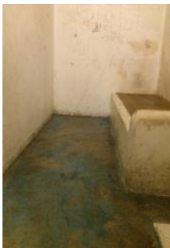
Une cellule de dégrisement

Les murs et le plafond sont couverts d'inscriptions. Le sol, qui devait être peint en bleu, laisse apparaître le béton brut sali sur la majorité de sa surface.