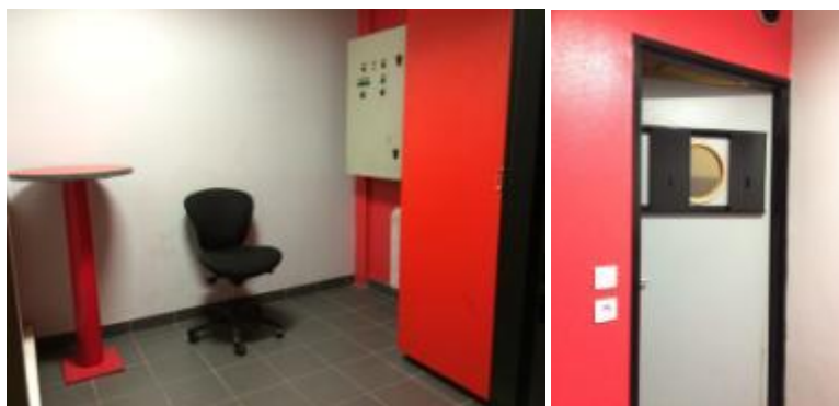
Le local de fouille