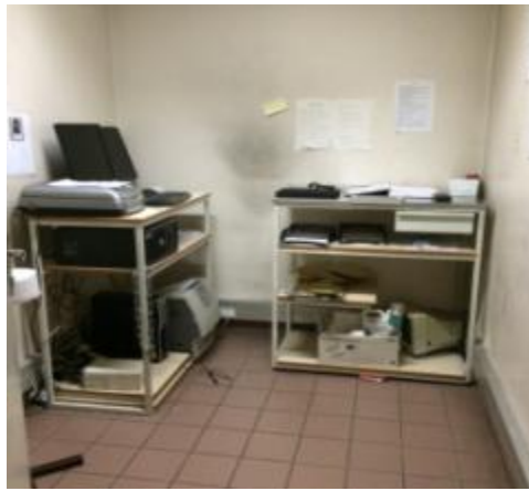
Le local dédié aux opérations d'anthropométrie