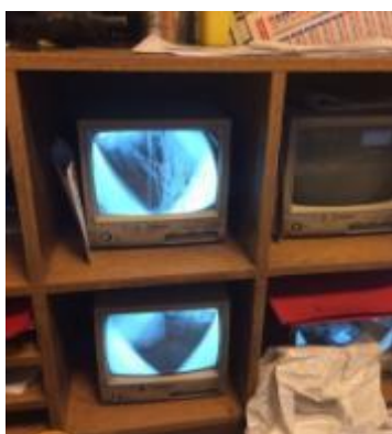
Les écrans de surveillance du chef de poste

Chaque cellule est pourvue d'une caméra de vidéosurveillance, sauf la plus grande cellule qui en a deux, dont une qui ne marche pas. Les images sont reportées dans le bureau du chef de poste sur des écrans anciens. La lentille d'une des caméras a été rayée, rendant la lecture des images difficile.