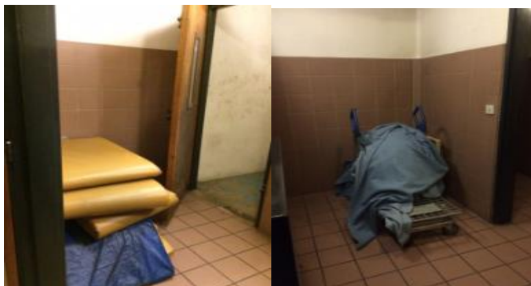
Le stock de matelas et de couvertures

Une dizaine de matelas et autant de couvertures sont stockés dans le sas des geôles de dégrisement. Les matelas sont en bon état. Il a été indiqué que deux matelas neufs ont été reçus en décembre 2014, ce qui a permis de se débarrasser des deux plus abimés. Les couvertures sont empilées de manière désordonnée sur un chariot. Certaines traînaient par terre. Il a été indiqué aux contrôleurs que chaque mardi ou jeudi, quatre couvertures étaient apportées à la direction territoriale de Seine-Saint-Denis à Bobigny, en échange de quatre couvertures propres. Néanmoins, une odeur nauséabonde se dégageait du tas de couvertures.