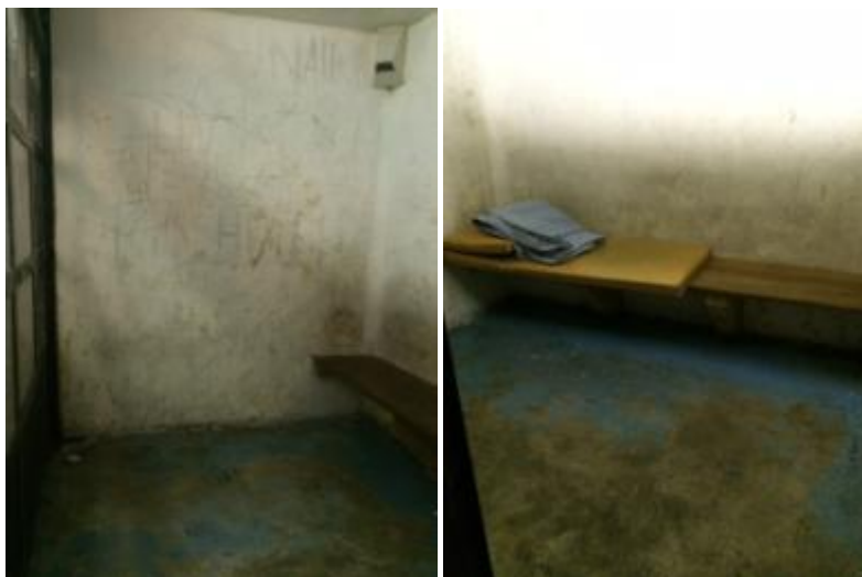
Des cellules de garde-à-vue

Les murs des cellules sont particulièrement dégradés, comportant de multiples inscriptions et traces de saleté. Le sol, qui devait être peint en bleu, laisse apparaître le béton brut sali en divers endroits. D'après les propos recueillis, ils n'ont pas été repeints depuis 2009.