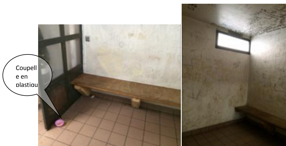
La cellule des mineurs