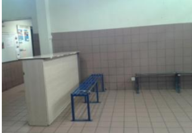
Le hall d'attente

Elles sont menées dans un hall d'attente face au bureau du chef de poste, et où sont situés la cellule utilisée pour les mineurs ainsi que le local d'entretien avec l'avocat et le médecin. Deux bancs métalliques de 22 cm de large, perpendiculaires, sont fixés au sol. Une des barres métalliques est manquante sur le banc ayant été le plus utilisé lors du contrôle, rendant l'assise fort peu confortable. Une paire de menottes était pré-positionnée sur un des bancs. Un comptoir en bois permet au chef de bord qui a mené l'interpellation d'effectuer les formalités nécessaires, une fois la personne interpellée assise et menottée à l'un des bancs.