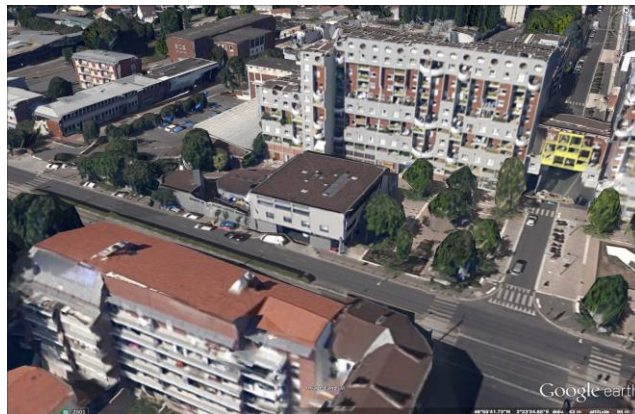
Le commissariat de La Courneuve –Vue Satellite 2

Le commissariat de la Courneuve se trouve 16 place du Pommier de Bois, le long de la rue de la Convention, ex-route nationale 186, à deux fois deux voies.