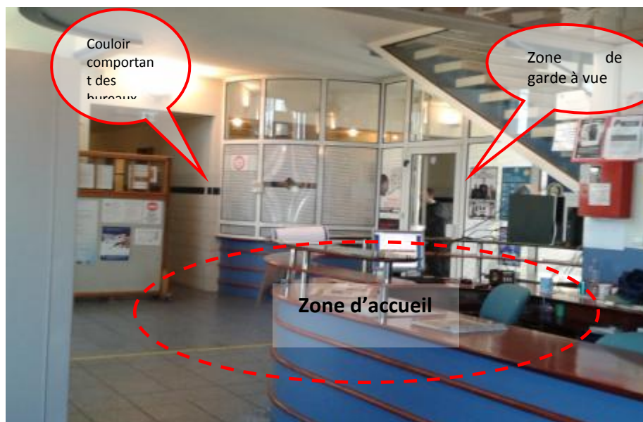
La zone d'accueil

Les bureaux d'audition sont bien éclairés par de larges fenêtres dépourvues de barreaux. Ils ne comportent pas d'anneau de menottage. D'après les propos recueillis, les menottes ne sont que très rarement utilisées.