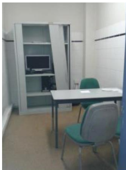
Le local utilisé pour la fouille, l'examen médical et l'entretien avec l'avocat

L'armoire est endommagée. Elle contient le matériel utilisé pour la visioconférence, qui fonctionne.