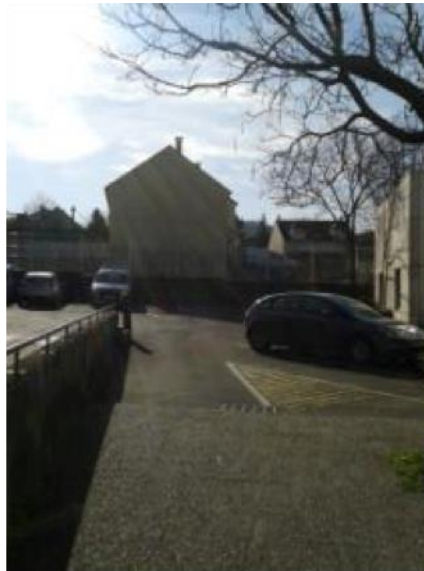
La cour intérieure et la maison mitoyenne

Durant le trajet, elles sont généralement menottées. La décision relève du chef de bord qui apprécie en fonction des circonstances. Lorsqu'il est décidé, le menottage s'effectue systématiquement à l'arrière. A l'arrivée, les équipages du commissariat entrent dans la cour intérieure et la personne interpellée accède aux locaux par la porte arrière, donnant un accès direct au poste ainsi qu'aux locaux de garde à vue. La cour est grillagée, mais néanmoins visible depuis la maison d'habitation qui se trouve de l'autre côté.