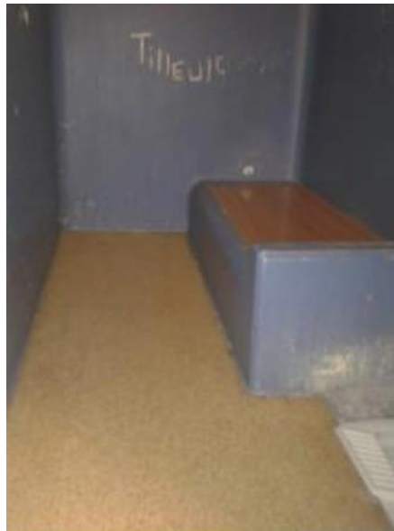
Une cellule de dégrisement

L'éclairage de la cellule et la chasse d'eau sont commandés de l'extérieur. Aucune lumière naturelle ne pénètre dans les geôles.