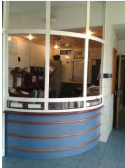
Le bureau du chef de poste

Dans l'aile arrière gauche du bâtiment sont implantés les lieux de privation de liberté soit quatre cellules et deux chambres de sûreté.