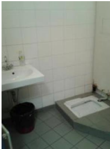
Le WC utilisé par les gardés à vue

A proximité du local « fouille – avocat – médecin », se trouve une douche hors d'état de fonctionnement, ainsi qu'un WC avec un lavabo. Ce dernier est très propre, et est équipé de papier toilette, de savon et d'une poubelle.