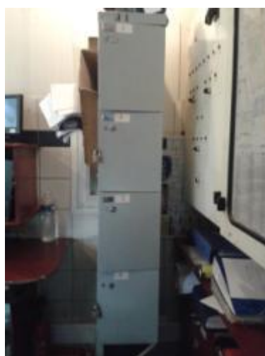
Les casiers pour la fouille

Les objets sont placés dans des casiers fermant avec un cadenas, situés dans le bureau du chef de poste. Pour les objets précieux, un coffre est à disposition dans le bureau du commissaire.