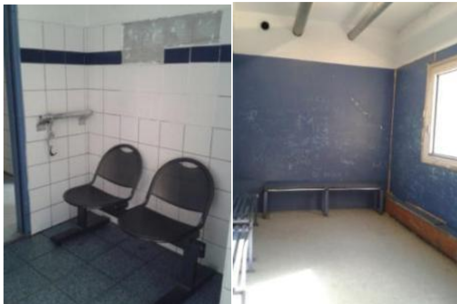
Les locaux d'attente