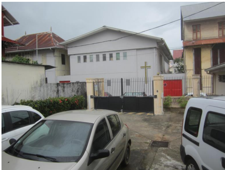
Cour arrière du palais de justice

En cas de besoin, les sanitaires utilisés sont alors ceux de la cellule d'attente (cf. infra ).