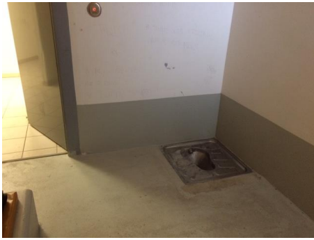
Le cabinet de toilette