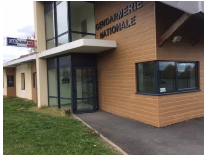
La gendarmerie de Doué-la-Fontaine

On accède à la gendarmerie après s'être identifié au portillon. Après un espace vitré se trouve le bureau d'accueil du public composé d'un couloir de 2,20 m de large sur 6,60m de long aménagé avec deux chaises. Cet accueil comporte au mur un affichage conséquent complété par deux présentoirs avec de la documentation relative à :