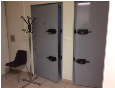
Les portes des deux cellules

Elles sont au nombre de deux et identiques :