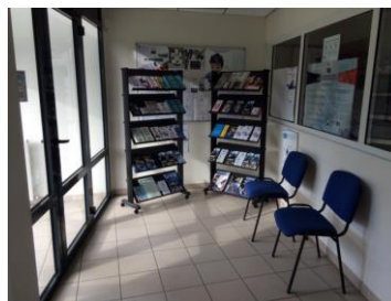
Le hall d'accueil

L'ensemble est en excellent état d'entretien et donne une image valorisante de l'institution.