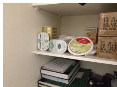
La réserve de plats préparés