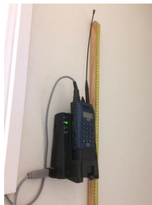
Le portatif radio relié à l'alarme

Le personnel n'a pas caché aux contrôleurs ses réticences. Il est craint, notamment de la part des personnes sous écrou pour ivresse publique et manifeste, un usage intempestif et permanent de l'appel pour nuire aux gendarmes.