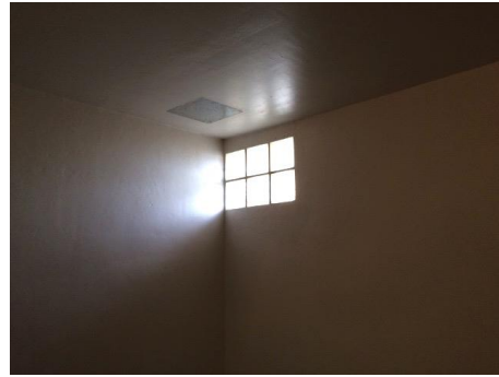
Le puits de lumière

Visible sur la photographie de gauche, un système d'appel a été installé dans la cellule (cf. paragraphe 3.5). Il n'y a pas de point d'eau, ni de caméra de surveillance dans la geôle.