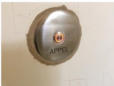
Le bouton d'appel