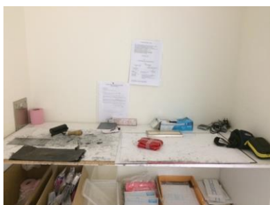
La table d'anthropométrie