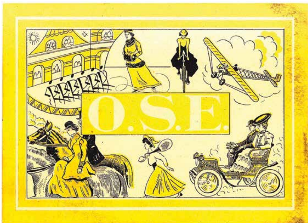
Carton d'invitation d'une vente de charité de l'OSE à Lyon en 1950

La dernière vente de charité de l'association a été organisée en 2007, dans la mairie du 16ème arrondissement à Paris.