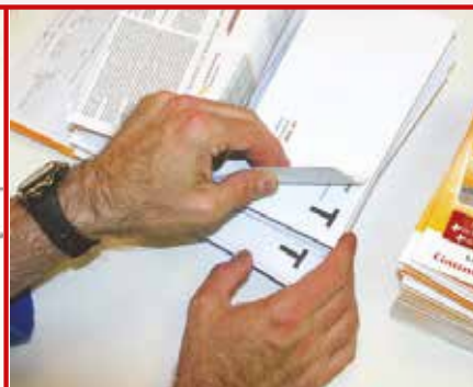
MISE SOUS PLI