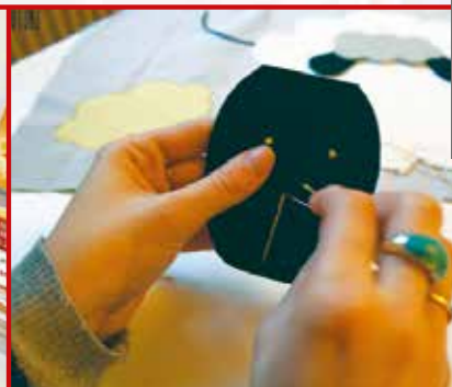
TRAVAUX DE COUTURE