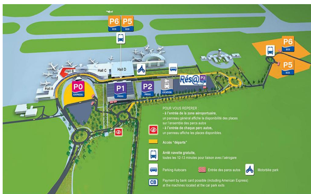
Plan de l'aéroport de Toulouse-Blagnac

La police aux frontières est localisée au sein de l'aéroport, au 3ème étage du hall C. Accessible par un ascenseur ou des escaliers et cela 24h/24, elle est également joignable par des bornes d'appel dans chaque hall.