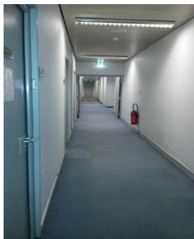
Photo 4: couloir public séparant les bureaux de la BMRA des locaux des cellules