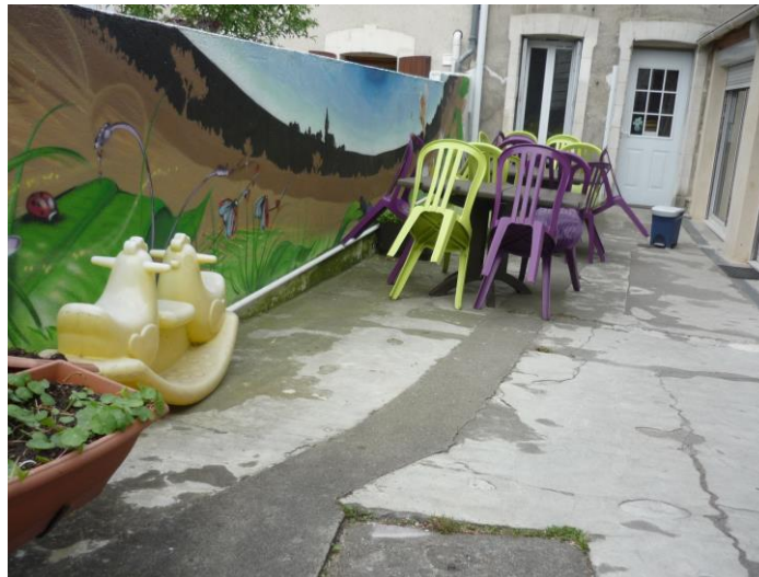
Cour et entrée de la maison d'accueil

La maison d'accueil achetée en 1986 grâce au legs d'une femme qui avait été précédemment incarcérée à la maison d'arrêt, est située juste en face de celle-ci. Elle dispose d'espaces réservés aux entretiens individuels et d'une salle permettant d'organiser des réunions.