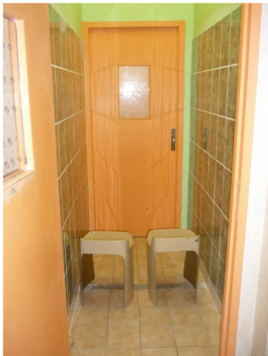
Une cabine de parloir

Des travaux ont été réalisés au sein des parloirs : le muret de séparation entre la personne détenue et le visiteur a été enlevé. Les dimensions des cabines (à une exception près) sont particulièrement réduites : 1,80 m de long sur 1 m de large (1,80 m 2 ). Les deux tabourets disponibles sont des tabourets adaptés à la taille d'un enfant : 0,43 m de hauteur pour une assise