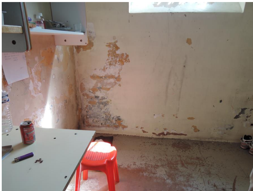
Cellule du quartier des hommes

Les cellules ont depuis 2009 été l'objet d'un programme de rénovation. Certaines cellules restent cependant plus dégradées que d'autres, comme cela pouvait déjà être observé en 2009.