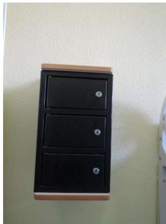
Coffres du quartier arrivant

Les tarifs des équipements sont affichés sur la porte de chaque cellule et un état des lieux est systématiquement établi à l'entrée et à la sortie.