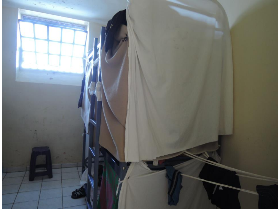
Usage détourné des draps et des couvertures

Les couvertures, dont l'usage était détourné en 2009, étaient lors de la visite de 2014 en place sur les lits. Quelques-unes d'entre elles avaient été découpées pour être utilisées comme cloisons amovibles afin de créer un espace d'intimité autour des lits.