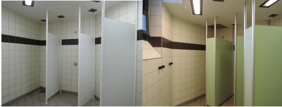
Douches du quartier des hommes

La température des douches est désormais réglée par le technicien. Plusieurs personnes détenues se sont plaintes que la température de la douche soit trop élevée.