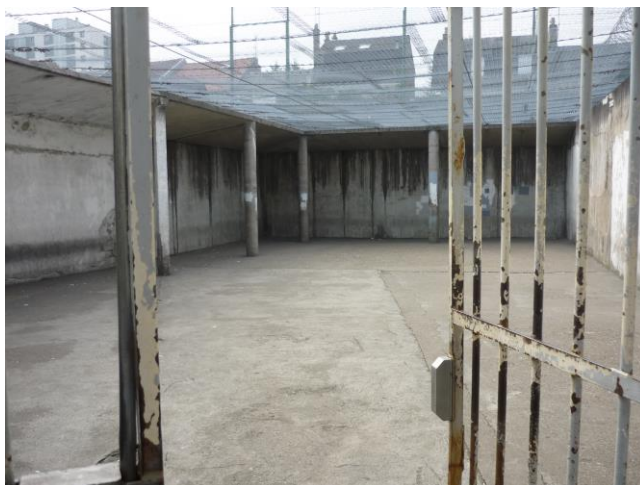
Une des deux cours principales de promenade