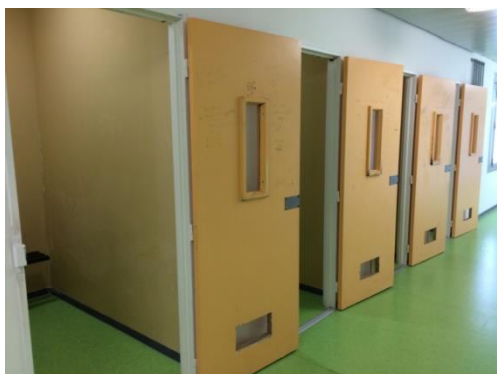
Box d'attente au sein de l'unité sanitaire