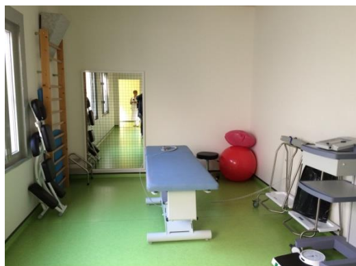
Cabinet du kinésithérapeute

A l'entrée de l'unité sont positionnés le bureau des deux surveillants et les sept boxes d'attente. Comme cela est visible sur la photo des boxes ci-dessus, une ouverture de ventilation a été réalisée dans chacune des portes, afin de réduire l'effet de confinement qui avait justifié une observation 32 en conclusion du rapport de visite de 2011.