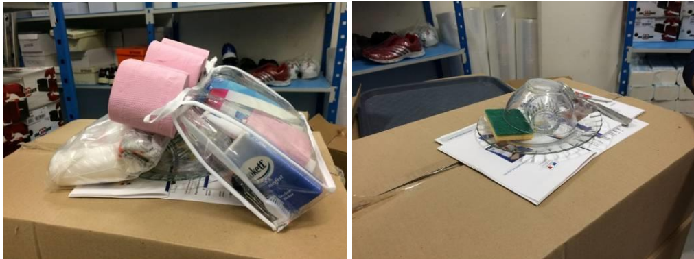
Contenu du paquetage remis aux arrivants

A sa demande expresse, chaque personne peut bénéficier d'une dotation « arrivant » de vêtement et sous vêtements avec notamment une tenue de sport.