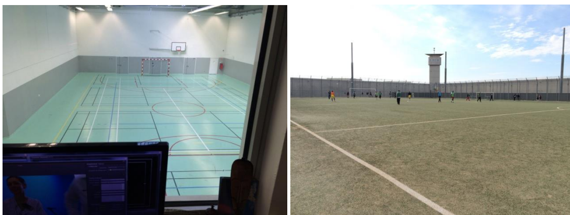
Installations sportives communes au CP

Une salle de gymnase avec le traçage pour des activités de volley, de badminton, de tennis et un stade en plein air, avec un traçage de football, sont les principaux sites d'activités sportives, hormis les salles de musculation qui se trouvent dans les différents quartiers. Ils sont équipés de sanitaires y compris le terrain extérieur, ce qui constitue une amélioration depuis 2011, mais en pratique les personnes détenues se douchent dans leur cellule.