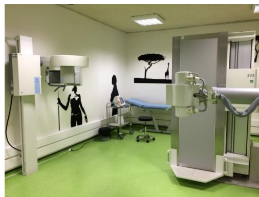
Salle de radiologie

Les bureaux médicaux, les deux cabinets dentaires, la salle de soins et le bureau infirmier, la pharmacie, le cabinet du kinésithérapeute, la salle de radiologie, les bureaux des psychologues et le secrétariat sont distribués de part et d'autre d'un couloir intérieur quadrangulaire, un patio central apportant l'éclairage naturel à certains des bureaux positionnés dans l'espace central de l'unité.