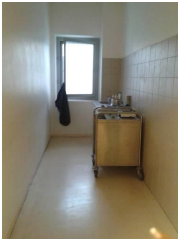
La cuisine du QSL