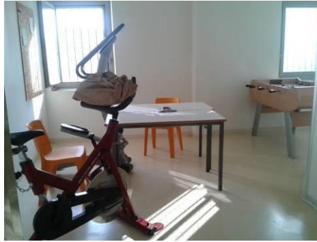
La salle d'activités et de musculation du QSL

Un téléphone est également accessible à l'entrée de l'aile de détention.