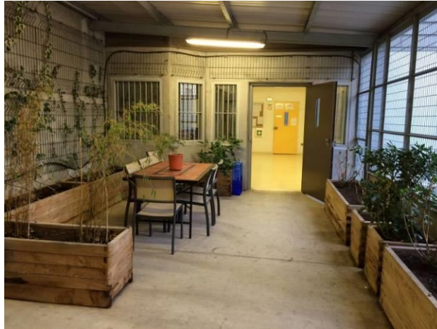
Entrée du quartier des arrivants

cohabitent en cas de besoin (nombre élevé d'arrivants ou détenu en situation de fragilité particulière). La fenêtre est équipée de barreaux et de caillebotis avec les répercussions tant sur le plan de la luminosité du lieu de vie que de la capacité de regarder à l'horizon.