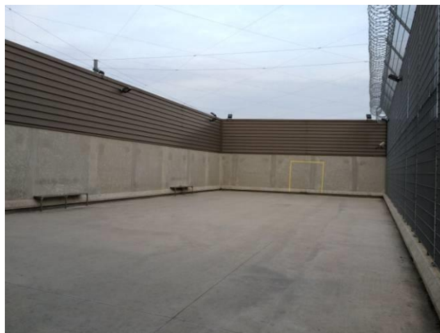
Cour du quartier des arrivants

Une brigade dédiée de dix agents qui assure le service de surveillance est commune pour les quartiers d'isolement et disciplinaire et celui des arrivants sous la responsabilité d'un gradé.