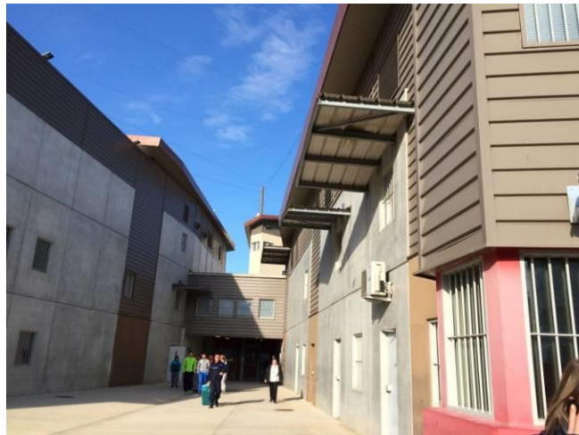
Arrivants se rendant à la réunion hebdomadaire d'accueil

Onze personnes détenues ont participé à cette réunion la semaine du contrôle.