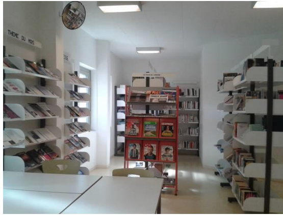
La bibliothèque du CD2