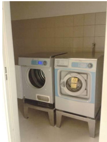
La buanderie du QSL