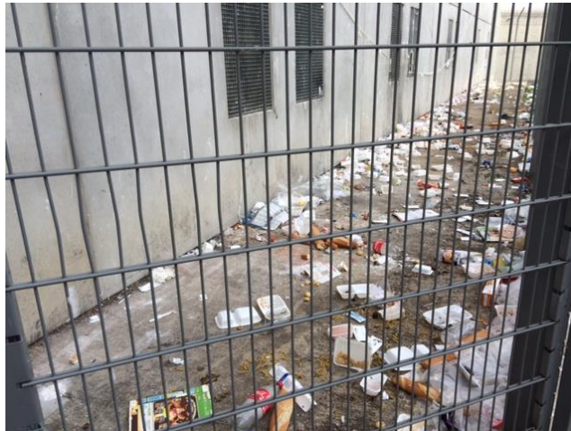
Vue d'un pied de façade d'un bâtiment d'hébergement

En 2011, il avait été relevé que « la pose générale de caillebotis concourt sans doute à limiter les jets d'ordures depuis les cellules : elle affaiblit sensiblement, on le sait, la luminosité de celles-ci ». En 2015, les contrôleurs ont pu constater que, malgré le maintien des caillebotis aux fenêtres, avec l'effet négatif indiqué, les jets d'ordure demeuraient conséquents ainsi que le montre cette photographie.