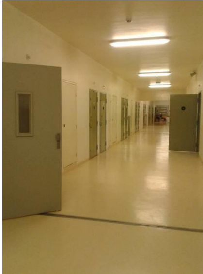
Aile du quartier de semi-liberté

Implanté dans l'aile droite du rez-de-chaussée du CD1, le quartier de semi-liberté a une capacité de vingt-sept places, dont une cellule pour personne à mobilité réduite.