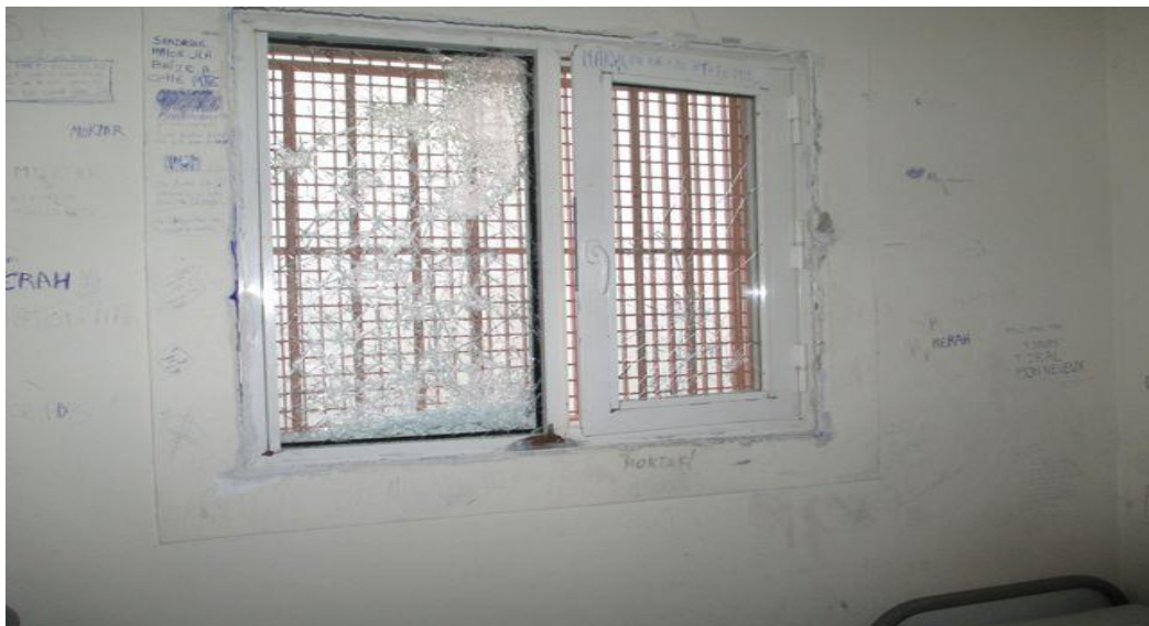
Fenêtre d'une cellule du quartier disciplinaire.

Toutes les cellules du quartier disciplinaires sont dégradées, de multiples graffitis sont gravés sur les murs. Les toilettes sont sales. Les fenêtres de trois cellules sur les quatre laissent apparaître des espaces entre le mur et les montants des fenêtres.