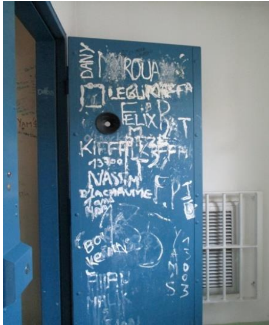
Porte de cellule dégradée

seules les cellules remises en peinture par l'occupant restent dans un état de très bon entretien.