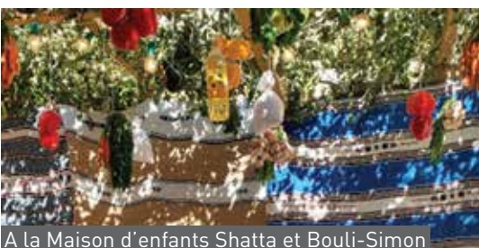
A la Maison d'enfants Shatta et Bouli-Simon