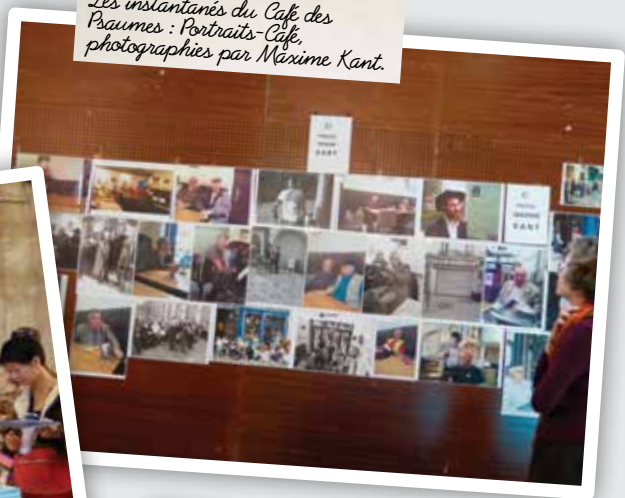
Les instantanés du Café des Psaumes : Portraits-Café.