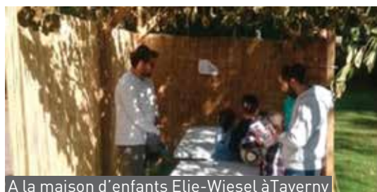
A la maison d'enfants Elie-Wiesel à Taverny