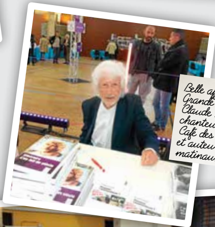
Belle affluence à la Grande Librairie Claude Berger, chanteur assidu du Café des Psaumes, et auteur des plus matinaux !