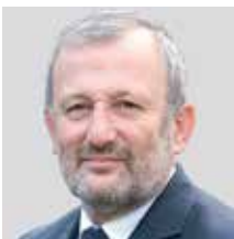
FRANÇOIS PUPPONI, Maire de Sarcelles

A Sarcelles dans le Val-d'Oise, il propose des ateliers de stimulation cognitive et un accompagnement personnalisé aux personnes en perte d'autonomie due au vieillissement. Le centre accueille largement les aînés de Sarcelles et du département. Il est implanté au cœur du quartier dit de la « Petite Jérusalem », où cohabitent de nombreuses communautés.