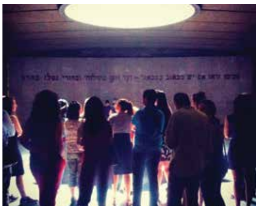
Des jeunes actifs de J'OSE ont accompagné des enfants de la maison Elie Wiesel au Mémorial de la Shoah