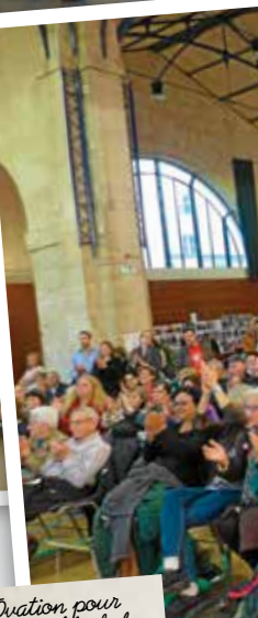
Ovation pour l'ensemble de la manifestation largement plébiscitée pour l'an prochain !