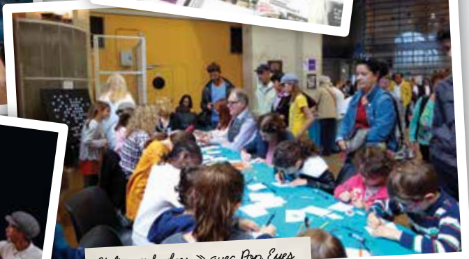
Atelier « badges » avec Pop Eyes pour la plus grande joie des petits comme des grands