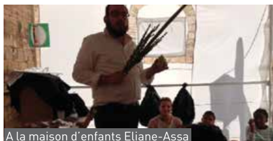
A la maison d'enfants Eliane-Assa