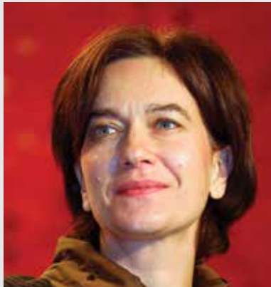
LAURENCE ROSSIGNOL, Secrétaire d'État chargée de la Famille, des Personnes âgées et de l'Autonomie

le champ de la protection de l'enfance, alors que chacune d'entre elle fournit un travail remarquable au quotidien. Il s'agit d'améliorer et de renforcer encore les réponses collectives que nous pouvons apporter pour mieux protéger les enfants.