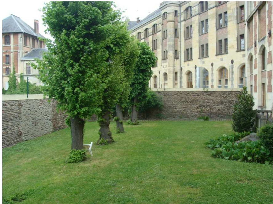
Cour de promenade affectée au quartier nurserie

La cour de promenade est pourvue de quatre chaises en plastique et d'une poubelle. Les femmes ont fabriqué un cendrier à partir d'une boîte de lait en poudre pour bébé pour éviter de jeter leurs mégots par terre.