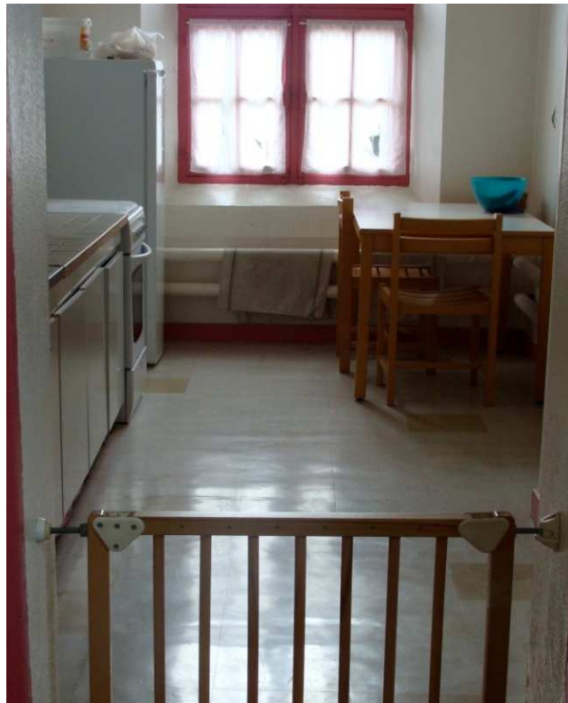
Cuisine du quartier nurserie

Sur les murs, plusieurs affiches sont apposées : un planning pour la vaisselle, l'essuyage et le nettoyage de la table et de la poubelle, le menu de la semaine, une information sur le recyclage, une information sur le mixage des légumes et de la viande pour les enfants et une information sur la collecte des bouchons. Un miroir mural est fixé au-dessus de l'évier.