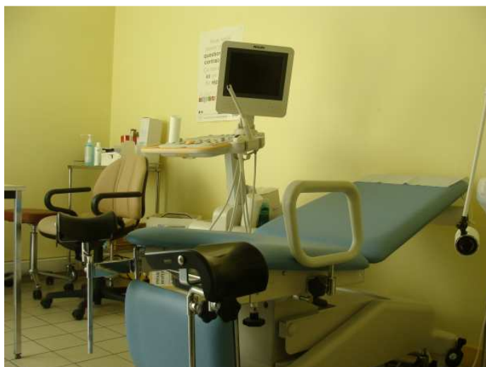
Bureau de consultation du médecin gynécologue

Au jour de l'enquête, la présence du gynécologue à l'établissement est particulièrement incertaine. Il a été indiqué aux chargées d'enquête que la gynécologue qui intervenait habituellement au CPF a cessé son activité en janvier 2013 et n'a été remplacée qu'au mois d'avril de la même année. Son temps de présence est fixé à une demi-journée tous les quinze jours ; toutefois les chargées d'enquête ont constaté que, dans les faits, sa présence est très aléatoire.