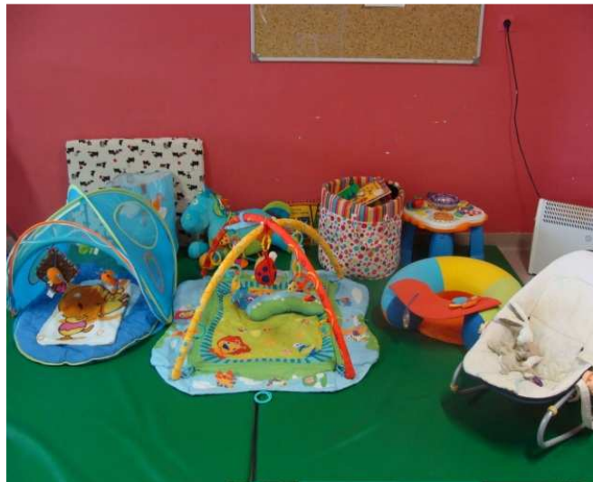
Tapis de jeux pour les enfants en bas-âge

Une cabine téléphonique est installée à droite de la porte du quartier nurserie. Il est possible aux femmes de fermer la porte de la cabine afin de préserver la confidentialité de leurs conversations. Une tablette et une chaise en bois permettent aux personnes détenues de s'asseoir et de poser leurs effets. Sont affichées à l'intérieur de la cabine : une note d'information de la commission nationale de l'informatique et des libertés (CNIL) sur l'écoute téléphonique, une note d'information sur les numéros du CGLPL, de l'Arapej et de la Croix-Rouge écoute et une affiche info service sur les hépatites.