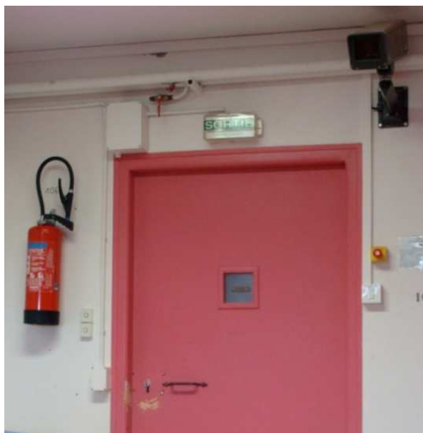
Porte d'entrée du quartier nurserie

Les cellules sont pourvues d'un bouton d'appel en état de fonctionnement. Les appels sont répercutés, la journée, dans le bureau des surveillantes et, la nuit, au poste central d'information. Il est indiqué que, en l'absence de système d'interphonie, un surveillant se déplace systématiquement en cas d'appel. Le cas échéant, un personnel gradé peut se rendre au quartier nurserie pour procéder à l'ouverture de la cellule.