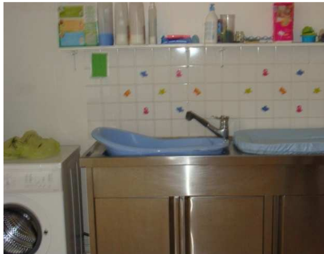
Bain des enfants dans la buanderie

Malgré la présence d'un radiateur, les femmes détenues ont indiqué que la température de la buanderie était particulièrement froide en hiver.