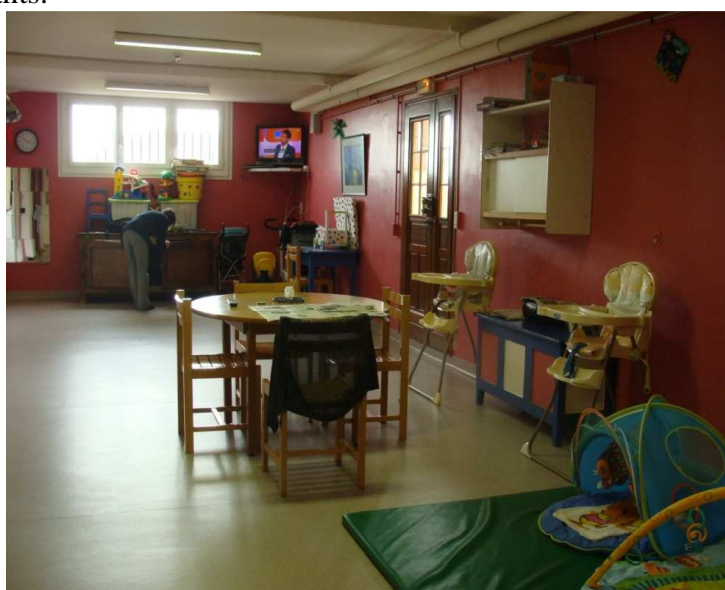
Pièce de vie du quartier nurserie

La pièce de vie est d'une surface de 70 m 2 . C'est un espace agréable et coloré partagé par les mères et les enfants.