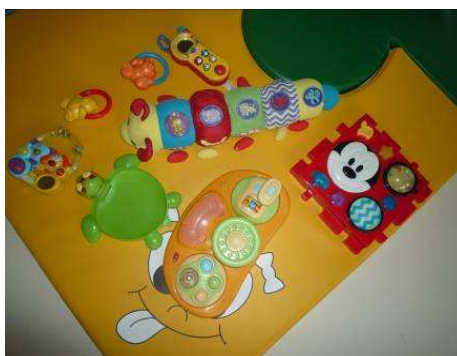
Jouets présents dans la salle d'activités