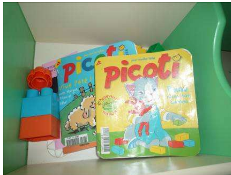
Jouets présents dans la salle d'activités

Cependant, les chargées d'enquête ont constaté que peu sont adaptés aux nourrissons et aux enfants de moins d'un an, en particulier s'agissant des livres de premier âge. Il est à noter que des livres pour enfants sont disponibles à la bibliothèque du quartier femmes. Néanmoins, celle-ci n'est accessible aux mères avec leurs enfants que lors des créneaux où les autres femmes détenues n'y ont pas accès.