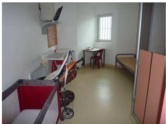
Cellule de la nurserie vide