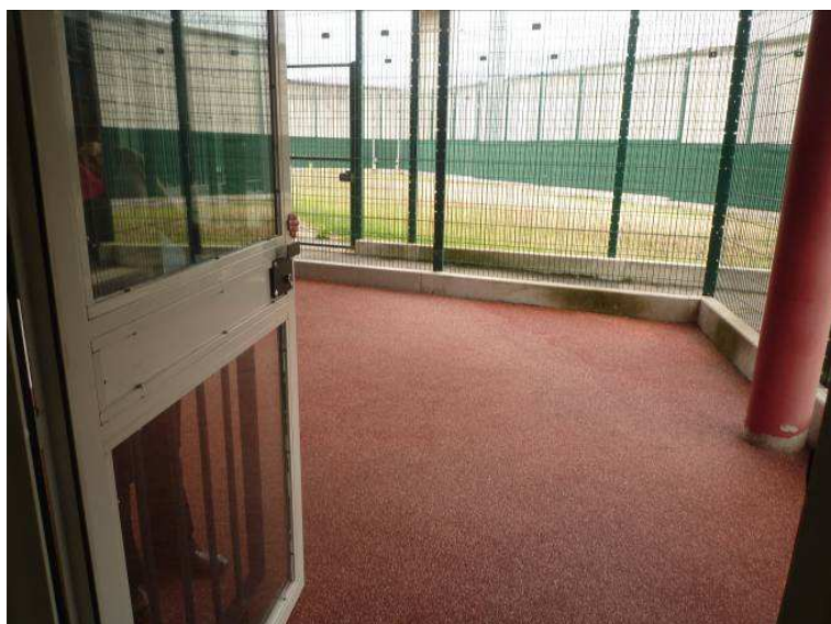
Cour de promenade

L'accès à la cour de promenade – d'une superficie de 24 m 2 environ – se fait par la salle d'activités via une lourde porte, sans loquet.