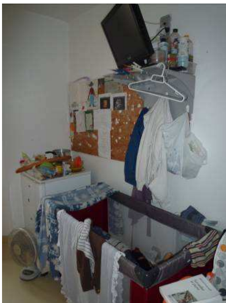
Positionnement du lit parapluie

Une mère a indiqué qu'elle avait dû procéder à plusieurs reprises au réaménagement de sa cellule pour décider de l'emplacement « idéal » du lit de son enfant. En effet, si celui-ci est trop près de la fenêtre, l'enfant peut être gêné par les bruits causés par les femmes détenues lorsqu'elles discutent la nuit ; s'il est proche de la porte de la cellule, l'enfant entend les nuisances sonores de la détention (mouvements des détenues, ronde des surveillantes, tintement des clés, etc.). Elle a donc décidé de placer le lit de son enfant contre un mur ne communiquant avec aucune autre cellule, au milieu de la pièce : sous le téléviseur et contre le radiateur.